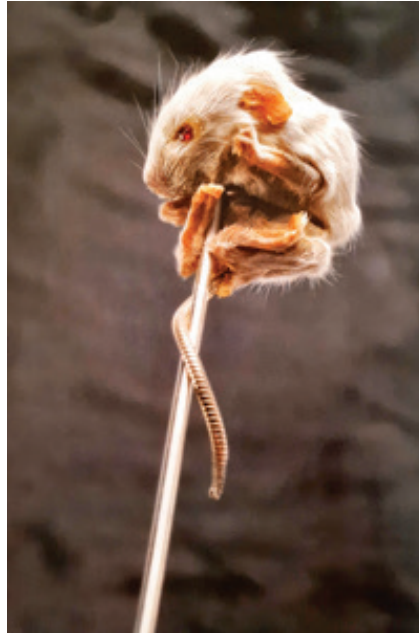
Görsel 8. Julia Deville, "Mouse-Pin" isimli broş; fare, yakut, gümüş, 18 ayar altın, 2004

Avustralyalı avangard takı sanatçısı Julia Deville, çalışmalarında malzeme olarak doldurulmuş hayvanları kullanmakta ve bunları siyah inci, fildişi ve mercan gibi değerli malzemelerle kombine ederek; süslenme ve ölüm arasında geleneksel bir ilişki kurmaktadır (Cheung (vd.), 2006, 164). Eğitimli bir tahnitçi olan Deville, organik malzemeyi gümüş ya da altının içine gömerek takılabilen hassas parçalara dönüştürmektedir.