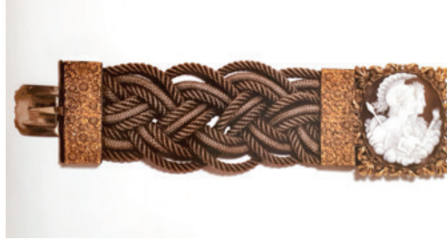
Görsel 2. İnsan saçından örülerek yapılmış bilezik, altın kilit kısmına kabuk cameo yerleştirilmiştir; t ahminen İsviçre'den, yaklaşık 1825 yılı (Victoria and Albert Müzesi, Londra)