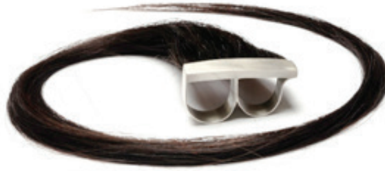
Görsel 12. Polly van der Glas, yüzük; insan saçı ve gümüş

Takı üretiminde aşırılık derecesinde sıradışı malzemeler kullanan bir diğer Avustralyalı takı sanatçısı ise, Polly van der Glas'tır. Sanatçı, takı ve küçük heykellerinde vücut ve ona yüklenen anlamları içeren temalar kullanmaktadır. 2005 yılından bu yana, van der Glas, bir zamanlar insan vücudunun parçaları olan ama kesilmiş ya da çekilmiş saç, diş ve tırnaklar ile çalışmaktadır.