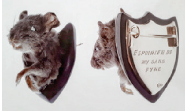
Görsel 10. Julia Deville "Gunclub" isimli broş; fare, pırlanta, oltutaşı, 9 ayar altın, 2004

İzleyicisinde şok etkisi yaratan bu avangard tasarımlar, ölümlü olma kavramını ve batının bir tabusu olarak ölüm anlayışını sorgulamaktadır. Deville çalışmalarında, sadece doğal nedenlerle ölen hayvanları kullanarak ölümü kutlamakta ve bunun, hayatın kutlanması olarak görülmesi gerektiğine inanmaktadır. Her parça, günümüzdeki hayatı uzatma ve koruma tutkumuzu sorgulayarak, modern standartların tekrar değerlendirilmesine neden olmaktadır. Deville; aslında ölümlü yaratıklar olduğumuz kavramını tanımlamanın önemli olması nedeniyle, çalışmalarında ölümün sembollerini kullandığını belirtmekte ve kültürümüzün doğasında yer alan geleceği planlama saplantısına kapılarak genellikle şimdiki zamanın tadını çıkarmanın unutulduğunu vurgulamaktadır. Viktorya dönemi matem takılarından ve ölümlü olduğumuzun hatırlatıcısı "Memento Mori" takılarından ilham aldığı açıkça görülen Deville, bir zamanlar yaşayan ancak öldükten sonra doldurulmuş ve korunmuş hayvanları takı formunda sunmasıyla; güzellik, korku ve ahlak kavramlarına meydan okumakta ve malzemede aşırılığa iyi bir örnek oluşturmaktadır (Cheung (vd.), 2006, 164).