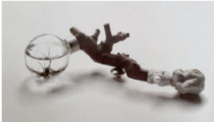
Görsel 5. Sebastian Buescher, “Pregnant Tree Boy” isimli broş; Ahşap, gümüş, porselen, inci, cam, karadul örümceği; 2005

Sanatta olduğu gibi, geçtiğimiz yüzyılda takı için de; dünya çapında uzman altyapısı, kendi eğitim programları ve galerileri, müze koleksiyonları ve koleksiyoncuları, kitap ve katalogları ile oluşturulmuş; yeni anlam, yeni bir form dili ve yeni bir estetik geliştirmek için her çeşit malzeme ve teknik kullanılmıştır. Bireysel stüdyo üretim ölçülerinde, en son teknolojinin erişilebilirliğinin ve kullanımının neredeyse imkansız olması nedeniyle, üretimde gelişmiş teknolojiden nadiren faydalanılmaktadır (Astfalck (vd.), 2005, 13).