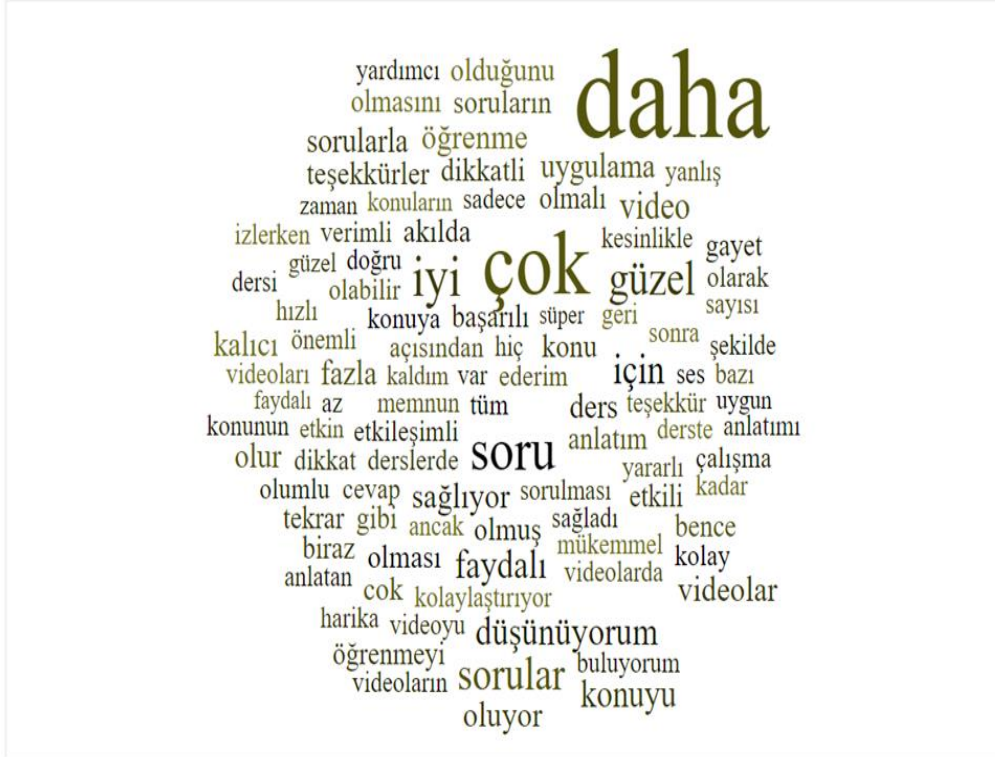
Şekil 5. Katılımcı Yanıtlarından Oluşturulan Kelime Bulutu

Açık uçlu soruya yanıt veren 898 katılımcının yanıtları kelime bulutu haline getirilmiş, en az 15 frekansa sahip 100 kelime görselleştirilmiştir. Şekil 5’te görüleceği üzere en çok kullanılan ilk beş kelime daha (n=401), çok (n=263), soru , (n=142), iyi (n=131) ve güzel (n=96) şeklindedir. Ortaya çıkan bu durum çalışmaya katılan öğrencilerin genel görüşünü ve memnuniyetini betimlemek açısından ayrıca ilgi çekicidir.