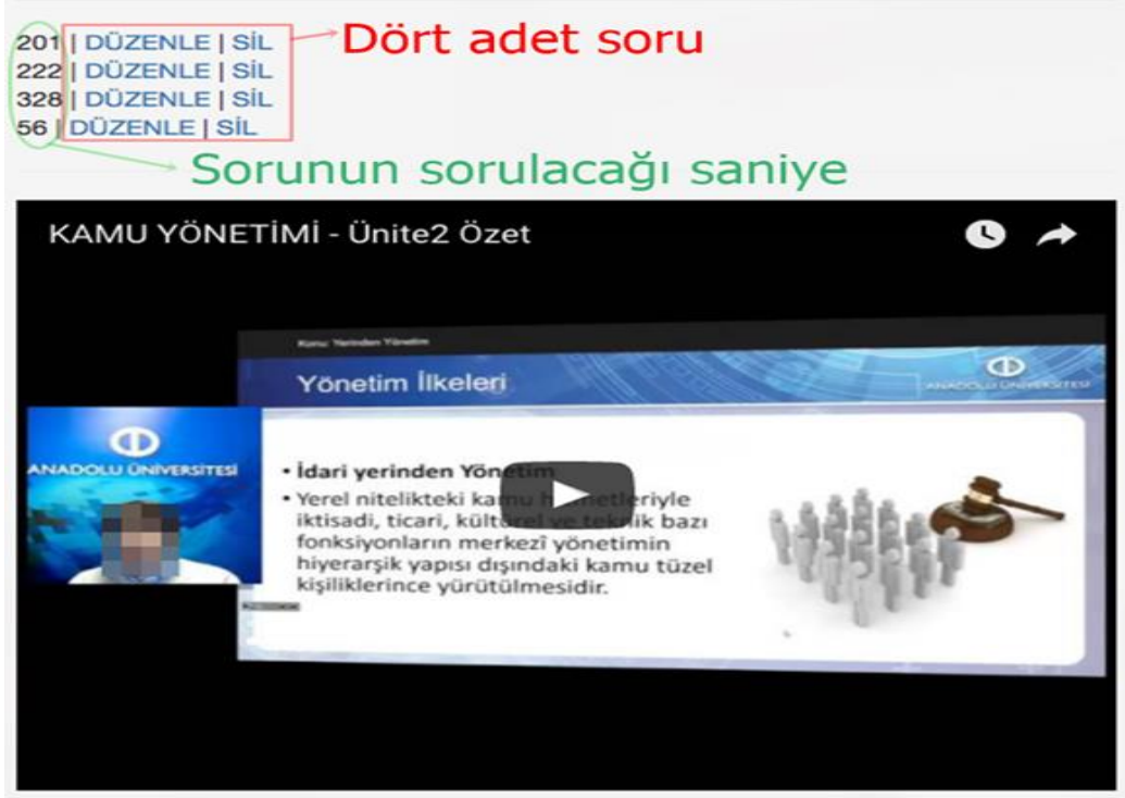
Şekil 2. Etkileşimli Video Soru Ekleme

Yazılımın geliştirilmesi: Soruların görüntülenmesinin yanı sıra soruların ve etkileşim türlerinin videolara eklenmesi için iki ayrı yazılım geliştirilmiştir. Bütünleşik olarak çalışan bu sistem, soru havuzundan ilgili videoyla alakalı soruları çekerek video yazılımına aktarma ve etkileşimleri ekleme fonksiyonlarına sahiptir.