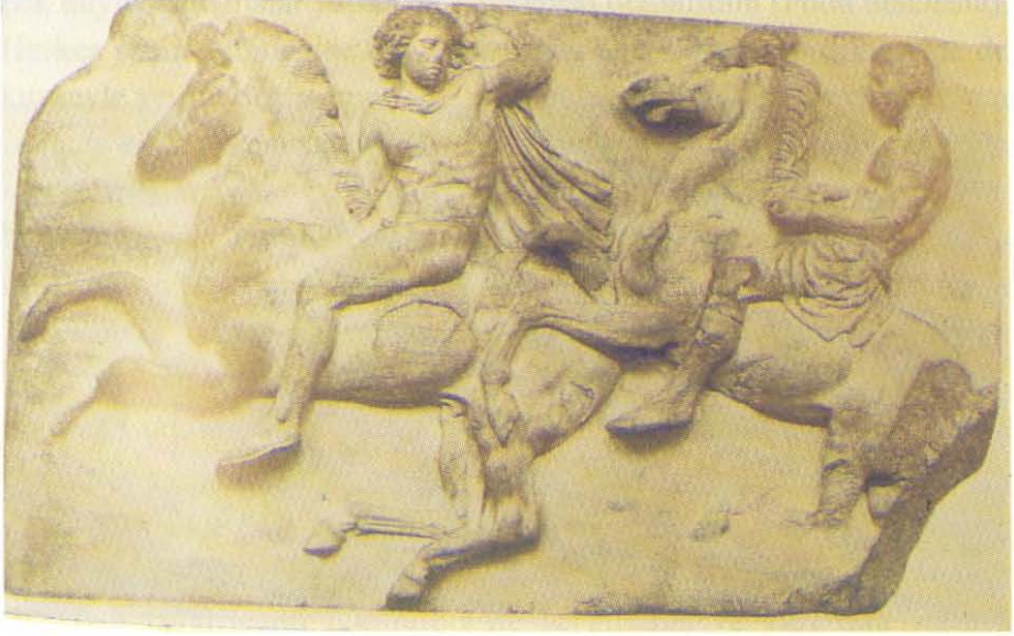
Resim 3: Athena Parthenon Tapınağı Batı Firizi. British Müzesi