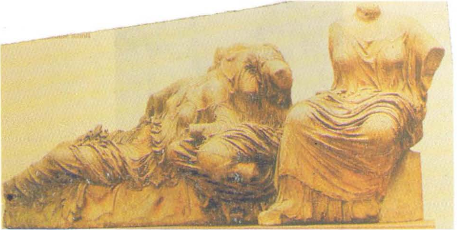
Resim 2: Athena Parthenon Tapınağı Doğu Alınlığı British Müzesi