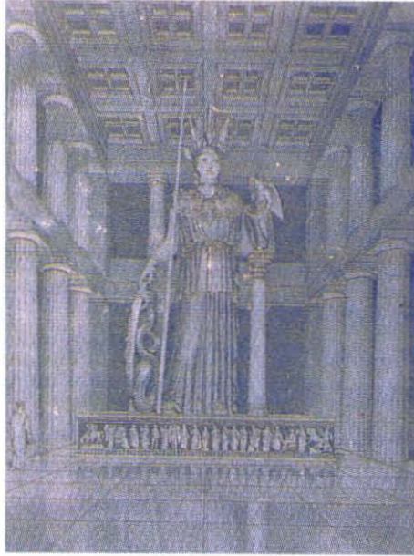
Resim 6: Athena Parthenos Klt Heykelinin Rekonstrksiyonizimi