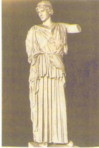
Resim 5: Athena Lemnia Heykeli. Dresden Müzesi