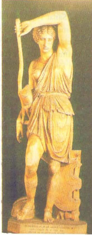
Resim 9: Mattei Amozonu Kapitolin Müzesi