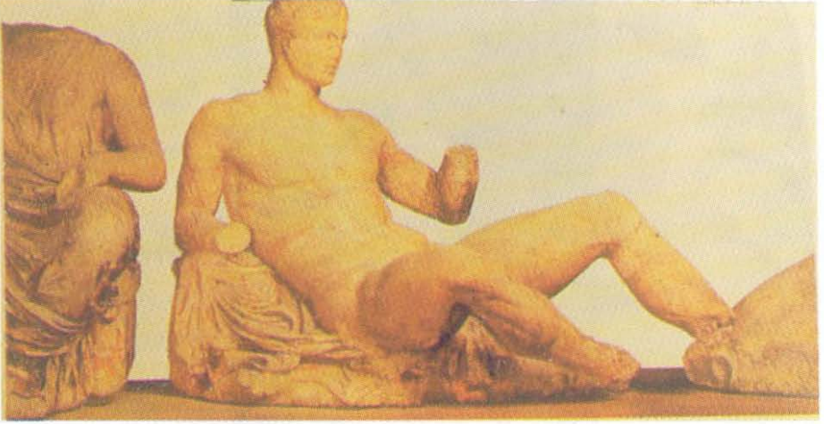
Resim 1: Athena Parthenon Tapınağı Doğu Alınlığı British Müzesi