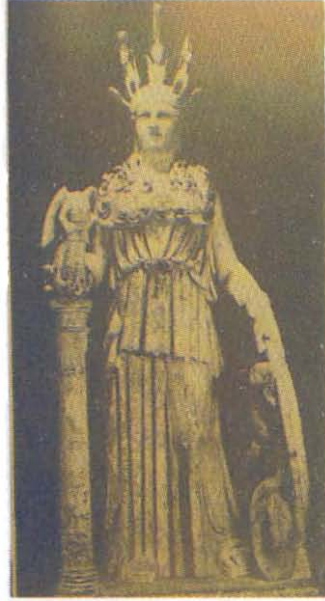
Resim 7: Athena Varvekeion Heykeli. Atina Milli Müzesi