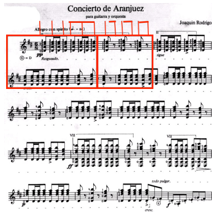
Görsel 13. Joaquin Rodrigo'nun Concierto de Aranjuez isimli konçertosunun birinci bölümü - ana tema