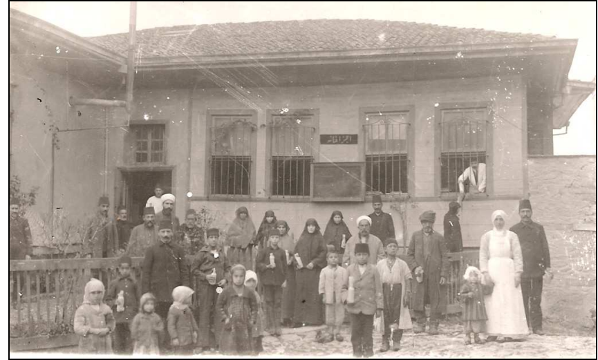
Aşçıbaşı Konağının cephesinde 'Eczahane' tabelası görülmektedir 15.

Aynı dönemde, Toptaşı Bimarhanesi'nde dört uzman hekim ve üç asistan bulunması, eczane kadrosunun, hekim kadrosuyla karşılaştırılabilecek düzeyde olduğunu göstermektedir. 13 Ancak, raporda Bimarhane'nin değişik bölümleri anlatılırken ayrıca bir eczaneden söz edilmemiştir. Yalnız, 'şimdiye kadar ükl ve şurubda, ilaç imal ve istihzaratında kumpanya suyu kullanılmakda iken' Çamlıca suyunun kullanılmasına başlandığı belirtilmiş, 'fennen ve tibben lüzumu olan ilaçlar verilememekle beraber, hasb-el icab ilaç ve şurublara konulmak için lüzumu olan şekerin bile kamilen kat' edilmiş olduğu kuyudatı-resmiye ile sabitdir' denilmiştir. 14