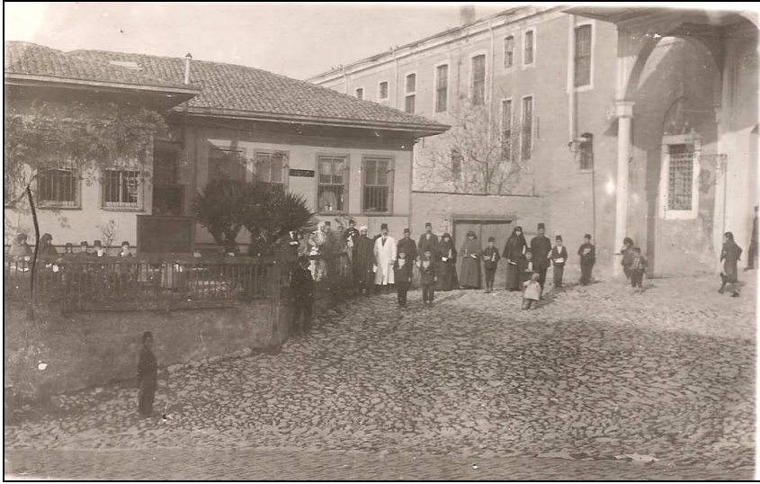
Toptaşı Bimarhanesi'nin girişi ve eczanesi (c. 1919)

Üsküdar Toptaşı Darüşşifası üzerine yapılan çalışmalarda, eczacıların görevleriyle ilgili, vakfiye ve talimatnamelerden aktarılan bilgilere yer verildiği halde, hastane eczanesine değinilmemiştir. 1