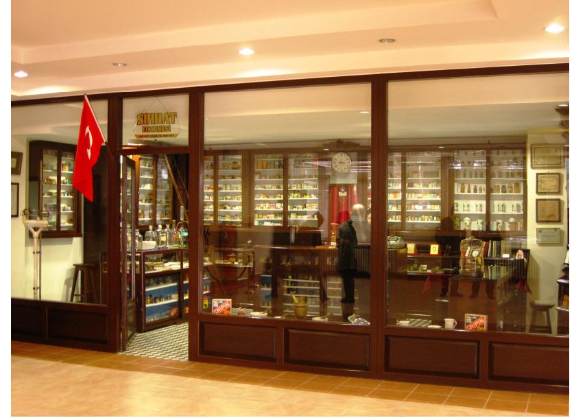
Sıhhat Eczanesi, Anadolu Üniversitesi Eczacılık Fakültesi'nde.