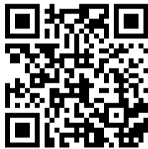
QR Code 2