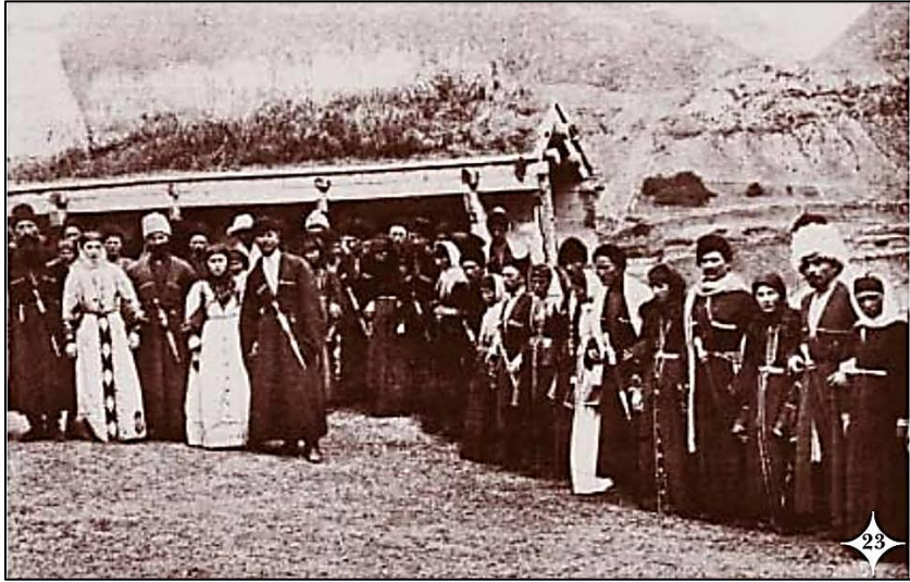
Fotoğraf 2: Sandırak Dansı, Kart-Curt, Şhaytı-Sırt, 1880 (Hotko, 2011: 423)