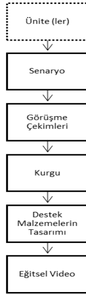
Şekil 2. Eğitsel Video Yapım Süreci

Bu çalışma kapsamında aktarılan eğitsel videoların geliştirilme süreci birbirini izleyen beş aşamada gerçekleştirilmiştir. Şekil 2’de görülen süreç öncelikle ilgili ders kitapları kapsamında odaklanılacak içeriğin belirlenmesiyle başlamaktadır. Videolar bazen tek bir ünite üzerine odaklanırken bazı durumlarda birden fazla ünite kapsama dâhil edilmiştir. Ünitelerin seçim sürecinde; eğitsel videoların dönem içerisinde TV aracılığıyla yayınlanacak olması ve dönemlik muhtemel video sayısının 4-5 şeklinde verilmesinin de etkili olmuştur. Sonuç olarak Stratejik Yönetim – I ve Stratejik Yönetim – II ders kitaplarında yer alan toplam 16 ünite için 9 video üretilmiştir.