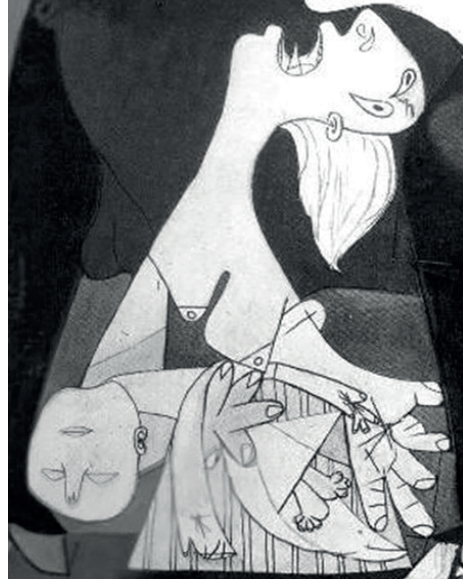
Resim5: Picasso, Guernica, 1937, Reina Sofia Müzesi, Madrid

Heykelde sıra dışı olan durum Meryem'in yüzünün genç olmasıdır, zira o zamana kadar yapılan heykellerde Meryem, genellikle yaşlı bir kadın olarak tasvir edilirdi. Michelangelo'nun, Meryemi alışılmışın aksine İsa'dan bile genç bir yüze sahiptir. Meryem'in bakireliği ve saflığını sembolize etmek için genç olarak tasvir ettiği söylenir. Meryem'in yüzünde sakin, dingin ve büyük bir huzur vardır. Acıyla birlikte hafif bir gülümseme içindedir. İsa, uzun boylu, annesi ise ufak tefek olmasına rağmen heykelde Meryem, oğlunu sarıp sarmalayacak kadar büyük yapılmıştır. Meryem'in sabrı ve gücü cüssesinin büyüklüğüyle uyumludur ve "tanrının oğlu" olan İsa, o an sadece onun dünyaya getirdiği küçük bebeğidir. Meryem, tüm dirayetiyle, hüznü bir yüz ifadesi içinde aşağı doğru bakarken çaresiz görünmez, oğlunu ait olduğu yere göndermenin huzuru, tanrıya karşı görevini yerine getirmiş olmanın tesellisi içindedir.