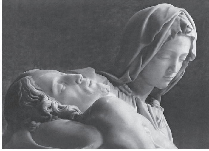
Resim3: Pieta, detay

Hıristiyan inancına uygun olarak, Tanrı'nın oğlu cansız bedeni ile annesinin kollarında yatmaktadır. İsa, annesi Meryem'in şefkatli kollarında, sanki hiç işkence görmemiş, hiç acı çekmemiş, hiç ölmemiş gibi yatmaktadır. Yüzünde büyük bir huzur ve hafif bir gülümseme vardır. "Meryem, İsa'nın bedenini sağ eliyle güçlü bir biçimde kavrarken, sol eliyle de naaşı izleyiciye sunmakta ve herkesi İsa'ya saygıya davet etmektedir. Meryem bunu yaparken gözlerini yere indirmiştir, böylelikle müminlerin yüzlerine doğrudan bakmak istemediğini gösterir. İsa bir ayağının ucuyla toprağa değmekte, oysa Meryem giysileriyle toprakla bütünleşmektedir. Michelangelo bu heykelda hem anne-oğul arasındaki bağı en iyi biçimde göstermiş, hem de mükemmel bir kompozisyon yaratmıştır. Pieta, Michelangelo'nun üzerinde imzası bulunan tek eseridir, aynı zamanda sanatçının en tamamlanmış heykeli olarak da bilinmektedir."(Vikipedi)