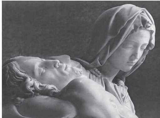
Resim 6: Pietà, detay, 1498-1499, Marble, 174 × 195 cm, St. Peter's Basilica, Vatican