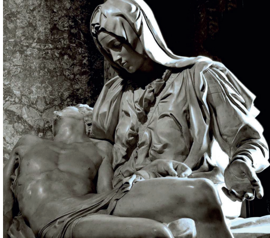
Resim4: Pieta, detay

"Meryem bir kayanın üzerinde oturmaktadır. Bir eli İsa'nın kol-tuğu altındayken diğer eli açık yukarı doğru bakmaktadır. Başının biraz eğik oluşu üzüntüsüne derinlik kazandırmaktadır. İsa'nın kafası, kolları ve bacakları aşağı doğru kendini bırakmıştır. İsa'nın cansız olduğu buradan anlaşılır. Michelangelo'nun ustalığı Meryem'in başındaki örtüde iyice belirginleşir. İsa'nın yarı çıplak vücudunda kaslar ve kemikler sadece anatomiye çok iyi bilen bir kişi tarafından yapılabilir. Meryem'in ve İsa'nın yüzü pürüzsüzdür. Michelangelo Meryem'i daha güzel ve genç fakat acı dolu bir yüzle betimlemiştir. Bu yüzden de yüz hatları oldukça sadedir. Yüzeylerin pürüzsüz, anatominin kursuz olmasına karşın oranlamada hata yapılmıştır. İsa'nın bedeni Meryem'in bedeninden daha küçüktür." (www.alka.com.tr)