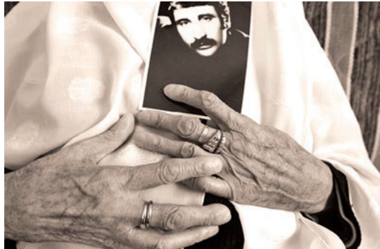
Resim 12: Cumartesi Anneleri Fotoğraf Sergisi’nden, 2012, Tütün Deposu, İstanbul