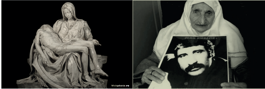
Resim1: Sol taraf: Michelangelo, Pieta, 1499, Sağ Taraf Berfo Ana ve oğlu, 2012

17. yüzyıldan itibaren ortaya çıkan ancak Foucault tarafından 20. yüzyılın sonlarında yeni bir iktidar biçimi olarak temellendirilen "biyoiktidar" kavramı, bedeni yönetmeyi seçen yeni bir tahakküm biçimi olarak günümüzde varlığını yoğun bir şekilde hissettirerek devam etmektedir. Bu makalede iki kadın karakterin oğlu üzerinde yapılan ötekileştirmeyi, biyoiktidarın izlerini, imge üzerinden sürmeye çalışacağız.