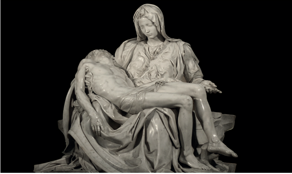
Resim 2: Michelangelo, Pietà, 498-1499, Type:Marble, 174 × 195 cm, St. Peter's Basilica, Vatican

“Pietà”, “Meryem ve İsa”, “anne ve çocuk” kutsal birliğini temsil eder. Anne çocuğu sever, çocuk anesini sayar, birbirlerini saygı ve sevgi ile ödüllendirirler. Bu tasvir ana oğul arasındaki en kırılğan ve en yakın ilişkiyi göstermesi açısından çarpıcıdır. İsa'nın üç farklı açı ile yerleştirilmiş vücudu Meryem'in giysileriyle uyum içindedir. Mermerin yüzeyi heykelin alımlılığına katkı sağlamak için en küçük noktalarına dek parlatılmıştır. Kuzey sanatından esinlenerek İsa'yı kıvrımlı bir kumaşa saran Michelangelo, piramidal bir kompozisyon düzeni içinde acıyı, ağır başlılığı ve acının anıtsallığını bir arada yansıtır.