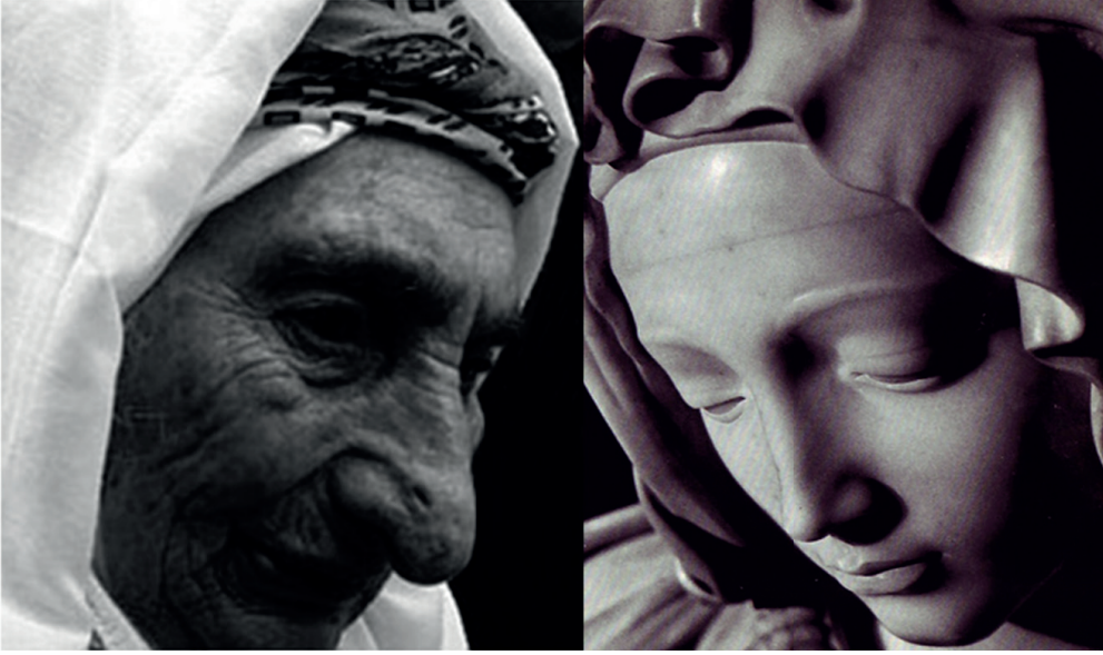
Resim 13: Yüzler

İsa, Golgota tepesinde ölmek üzereydi. Meryem ise, haçın altında sınırsız bir acıyla, sınırsız bir merhametle ve inançla oğlunu izlemekteydi. Meryem, bir annenin yaşabileceği en büyük acıyı yaşamaktaydı.