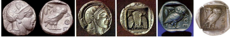
Resim 3. Eski Yunanda Atina kentinde basılan madeni paralar ve Attika sikkelerinin önyüzlerinde Tanrıça Athena'nın kabartma resmi, arka yüzlerinde ise baykuş kabartma resmi bulunmaktadır.

Mitolojide önemli bir yer kaplayan, Atina şehrinin koruyucu tanrıçası olan Athena adına bir çok yerde tapınaklar inşa edilmiş, paralar ve heykeller yapılmıştır. Bu kentin paraları üzerine baykuş resimleri basılmıştır (Resim 3).