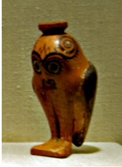
Resim 10. Baykuş formunda bir alabastron (parfüm şişesi), Doğu Yunan, Arkaik dönem, M.Ö. 6. Yüzyıl, Museum of

Yunanlı çömlekçiler, hydria'nın bir farklı türü olan kalpis'i, göz yaşlarını biriktirmek için üretmişlerdir. Taşıma ve boşaltmaya yardımcı olması için üç kulplu tasarlanmış bu hydria, Getty Villa, Malibu, California koleksiyonuna aittir (Resim 10).