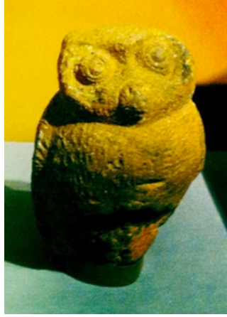
Resim 14. "Pişmiş Toprak Baykuş", Lagos Ulusal Müzesi.

Lagos Ulusal Müzesi koleksiyonunda bulunan, sırsız, pişmiş topraktan yapılmış, yüksekliği yaklaşık 12.5 cm boyutunda olan baykuş örnek, Afrika kıtasında bulunan Nijerya'nın İfe Krallığı döneminde, Yoruba topluluğu tarafından 12. - 15. Yüzyıl'da üretilmiştir (Resim 14).