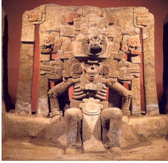
Resim 1. Ölüm ile ilişkilendirilen Aztek Mictlantecuhtli Tanrısının, çoğu zaman başlığında baykuş tüyleri ile tasvir edilmiş heykeli. ( http://www.mexican-folk-art-guide.com/day-of-the-dead-history.html#.UrFgPI3WG7g )

Orta Asya Arap mitolojisinde, baykuş kötü alamet olarak görülürdü.