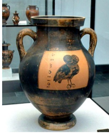
Resim 8. Antik Yunan Baykuşlu Form, Antikensammlungen Müzesi, Münih, Almanya.

Yunan kırmızı-siyah seramiklerinde “baykuş” figürü farklı formlar üzerinde uygulanmıştır “Anna A. Lemos (1991)”. Bazen bir vazo, bazen bir tabak, bazen de bir saklama kabı, hydria (Antik Yunanda kullanılan, biri dökmek için dik, ikisi kaldırmak için yatay, üç kulba sahip su testisi), kalpis (hydria’ya benzer fakat boynu hydriadan daha dar olan üç kulplu bir kap formu), lekythos (tek kulplu, dar boyunlu, kapalı bir tür Antik Yunan kap formudur, zaman içinde boyu uzamış ve gövdesi daralmış, sürahi, testi benzeri bir kullanımı/formu vardır) yada skyphos (ayaksız, iki kulplu, küçük, antik yunan seramik içki kupası) üzerinde baykuş figürü ile karşılaşılabilmektedir (Resim 8).