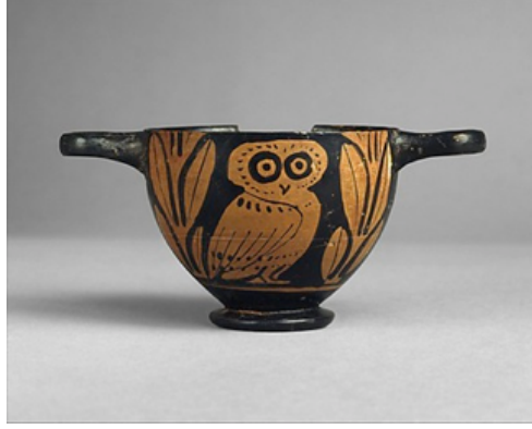
Resim 7. Attika, Yunanistan Kulplu Pişmiş Toprak Vazo, M.Ö. 5. Yüzyıl, Metropolitan Müzesi, İngiltere.

Yunan kırmızı-siyah seramiklerinde “baykuş” figürü farklı formlar üzerinde uygulanmıştır “Anna A. Lemos (1991)”. Bazen bir vazo, bazen bir tabak, bazen de bir saklama kabı, hydria (Antik Yunanda kullanılan, biri dökmek için dik, ikisi kaldırmak için yatay, üç kulba sahip su testisi), kalpis (hydria’ya benzer fakat boynu hydriadan daha dar olan üç kulplu bir kap formu), lekythos (tek kulplu, dar boyunlu, kapalı bir tür Antik Yunan kap formudur, zaman içinde boyu uzamış ve gövdesi daralmış, sürahi, testi benzeri bir kullanımı/formu vardır) yada skyphos (ayaksız, iki kulplu, küçük, antik yunan seramik içki kupası) üzerinde baykuş figürü ile karşılaşılabilmektedir (Resim 8).