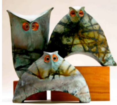
Resim 28. "Üç Baykuşlar"