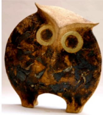
Resim 27. "Üzüm I".

Deniz Onur Erman, baykuşun gözlerini, bakişlarını, pençelerini, duruşunu, hareketlerini, ifadesini kil ile birleştirerek stilize edilmiş seramik formlara, yüzey uygulamalarına, çoklu düzenlemelere ve tekli figüratif çalışmalara dönüştürür. Seramik uygulamalar yaparken farklı türde kiler kullanır, değişik pişirim yöntemleri dener, kimi çalışmalarında ise kille birlikte yan malzemeler kullanır. Sanatçı, yüzey uygulamaları seramik duvar karoları ve duvar tabakları şeklinde çalışır, form çalışmalarında baykuş soyutlamaları, stilize baykuş yorumları, tekli ya da grup halinde sergilenen formlar dikkat çekmektedir (Resim 27-28).