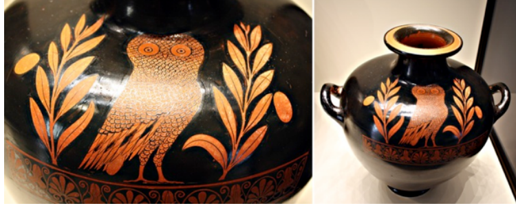
Resim 9. Attika kırmızı figürlü, yaklaşık 35 cm yüksekliğinde pişmiş toprak form, M.Ö. 480-470.

Yunanlı çömlekçiler, hydria'nın bir farklı türü olan kalpis'i, göz yaşlarını biriktirmek için üretmişlerdir. Taşıma ve boşaltmaya yardımcı olması için üç kulplu tasarlanmış bu hydria, Getty Villa, Malibu, California koleksiyonuna aittir (Resim 10).