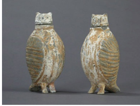
Resim 5. Beyaz ve gri renkli seramik baykuşlar, Yükseklik: 20.3 x Genişlik: 8.9 x Derinlik: 10.2 cm., M.Ö. 206-220, Han Hanedanlığı / Çin. ( http://www.hmluther.com/productpage2.php?subcategory=SCULPTURE&parent=ART&item=7333 )

M.Ö. 206 - M.S. 220'ye tarihlenen Çin Han Hanedanlığı döneminde üretilmiş, bir çift beyaz ve gri pişmiş toprak baykuş, Paris, Guimet Müzesi (Musée National des Arts Asiatiques-Guimet), koleksiyonunda bulunmaktadır. Her biri alçak rölyef ile şekillendirilmiş kanatlara ve oval vücudunun üzerinde hareketli bir kafaya sahiptir, iki ayakları ve kuyrukları üzerinde durmaktadır (Resim 5).