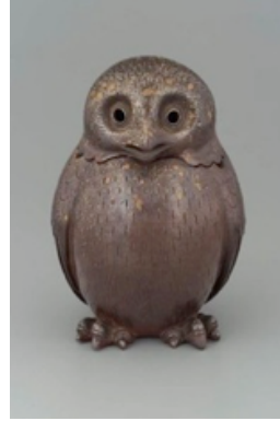
Resim 17. Tsushima seramiği baykuş.

Kaliforniya Bilim Akademisinin Antropoloji Koleksiyonda bulunan, Kuzey Amerika, Zuni Pueblo kültürüne ait, 1940-1960 yıllarına tarihlenen, Küresel vücuduna modellenmiş kanadı, kuyruğu, kulakları, gagası ve ayakları ile ayakta duran 17.2 cm yüksekliğinde, 9.3 cm genişliğinde ve 9.1 cm derinliğinde olan baykuş heykelciğinin, kuyruk altında büyük yuvarlak bir deliği vardır. Beyaz astarlıdır ve dış yüzeyine pürüzsüz bir kazıma dekoru uygulanmıştır. Bünye üzerine tüy deseni koyu kahverengi boya ile boyanarak verilmiştir. Açık pozisyonda olan gagası, ayakları ve bakışını tam anlatabilmek için göz etrafı kırmızı boya ile dekorlanmış, imzasız bir heykelciktir (Resim 18).