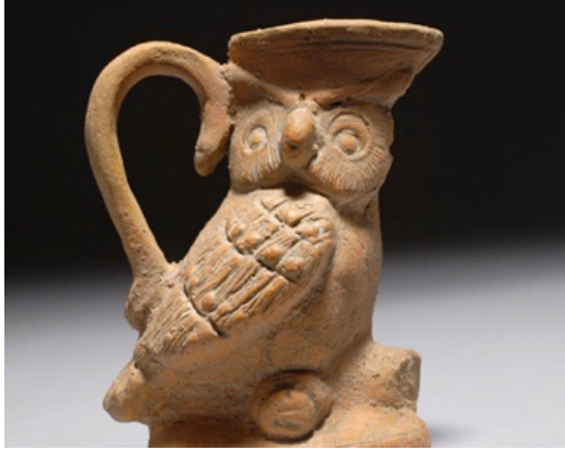
Resim 12. Antik Roma Kuzey Afrika Baykuş Figürlü Kap, Yükseklik yaklaşık 17 cm, M.S. 300.

Aslında, hayvan formlu seramikler Korint'ten (Gördüs / Gördös, Mora Yarımadası'nı Yunanistan anakarasına bağlayan Korint Kıstağı'nın üstünde yer alan bir şehir devletiydi) Atina'ya gelmiş olmasına rağmen, altıncı yüzyıla doğru yol alındıkça, Attika üretim özellikleri Korint bölgesindeki seramik üretim gelişmelerini etkilemiştir. New York Metropolitan Sanat Müzesi koleksiyonunda olan aşağıdaki ağızlıklı baykuş şişe bu duruma örnek bir Attika eserdir (Resim 13).