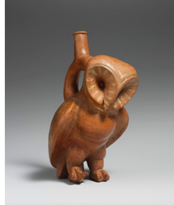
Resim 13. Ağızlıklı Baykuş Şişe, 2. - 3. Yüzyıl, Peru bölgesi, Moche kültürü, yükseklik 24.1 cm, genişlik 11.7 cm.