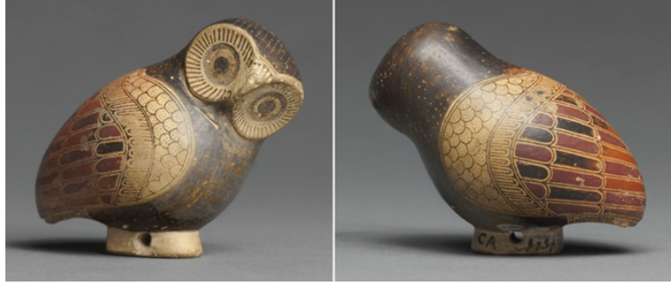
Resim 11. "Minyatür Baykuş", İkel Korint Dönem, Oryantalist Dönem, M.Ö. 725-600. Uzunluk 5 cm, siyah, beyaz ve pişmiş toprak renk, Louvre Müzesi.

Antik Roma Kuzey Afrika seramik sanatının nadir örneklerinden bir tanesi olan, olağanüstü bir şekilde tüylerin kazıma tekniği ile şekillendirildiği, oturmuş, yandan bakan, muhtemelen kozmetik veya diğer değerli merhemleri saklamak için üretilmiş minyatür pişmiş toprak kap örneği, M.S. 300'lere tarihlenmektedir (Resim 12).