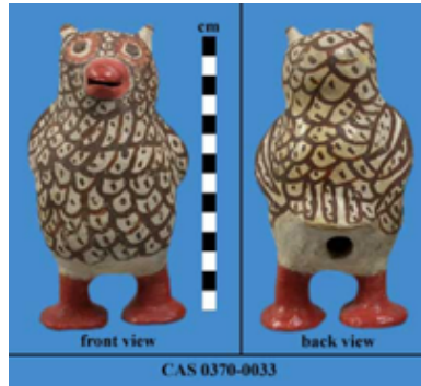
Resim 18. "Pişmiş Toprak Baykuşlar", Lagos Ulusal Müzesi.

Kaliforniya Bilim Akademisinin Antropoloji Koleksiyonda bulunan, Kuzey Amerika, Zuni Pueblo kültürüne ait, 1940-1960 yıllarına tarihlenen, Küresel vücuduna modellenmiş kanadı, kuyruğu, kulakları, gagası ve ayakları ile ayakta duran 17.2 cm yüksekliğinde, 9.3 cm genişliğinde ve 9.1 cm derinliğinde olan baykuş heykelciğinin, kuyruk altında büyük yuvarlak bir deliği vardır. Beyaz astarlıdır ve dış yüzeyine pürüzsüz bir kazıma dekoru uygulanmıştır. Bünye üzerine tüy deseni koyu kahverengi boya ile boyanarak verilmiştir. Açık pozisyonda olan gagası, ayakları ve bakışını tam anlatabilmek için göz etrafı kırmızı boya ile dekorlanmış, imzasız bir heykelciktir (Resim 18).