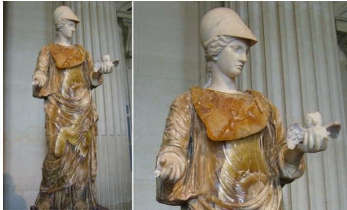
Resim 2. Baykuşlu Tanrıça Athena, Louvre Müzesi.

Yunan Mitolojisinde, zeka, sanat, strateji, barış ve savaşın tanrıçası olarak bilinen Athena'nın sembolleri; mızrak, zeytin dalı ve baykuş'tur. Mızrak; savaşı, zeytin dalı; barışı, baykuş ise; akıl ve bilgeliği temsil eder. Athena'nın babası Tanrıların Tanrısı Zeus, annesi ise Hikmet Tanrıçası Metis'tir. Athena Yunan kentlerini koruyan, barış, akıl, strateji tanrıçası olarak ün yapmış, Roma dönemlerinde ise minerva isminde aynı ilgiyi görmüştür. Louvre Müzesinde, M.S. 2. Yüzyıl'a ait, yaldızlı oniks ve beyaz mermerden üretilmiş, Minerva isimli Baykuşlu Tanrıça Athena heykeli bulunmaktadır (Resim 2).