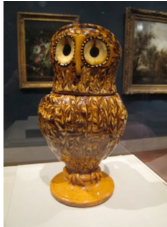
Resim 15. "Baykuş Sürahi", Staffordshire, İngiltere, 17. Yüzyıl, (1690-1710), Earthenware Bünye, Kurşunlu Sır, 23.5 x 15.24 x 15.24 cm, Nelson-Atkins Müzesi, İngiltere.

İngiltere Nelson-Atkins Müzesi koleksiyonu olan, turuncu Earthenware , "Baykuş Sürahi", Staffordshire bölgesi üretimidir. İngiltere'deki bu bölgede; 17. Yüzyılın başlarından beri earthenware pişmiş toprak bünyeli ve kurşunlu sırlı ürünler üretilmekteydi ve aşağıdaki örneğe benzer üretimlere rastlamak mümkündür (Resim 15).