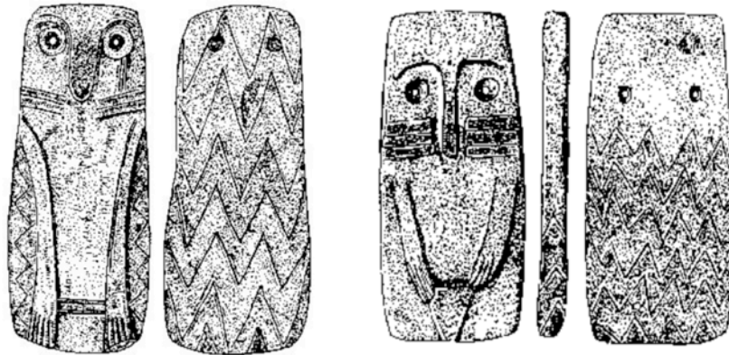
Resim 4. Kalkolitik Döneme ait olduğu düşünülen Tessalyan Sesklo kültürüne ait üzeri "Zik-Zak" ve "V" şeklinde kazınmış baykuş ana tanrıça betimlemeli figürinlerin önden ve arkadan görünümü.