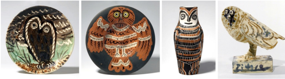
Resim 20. a) Baykuş desenli tabak, Vallauris, 1947-1948, Beyaz earthenware bünye, tornada şekillendirilmiş, kazıma yapılarak oksitler ve astarlarla dekorlanmış, saydam sırlı pişirilmiştir. 37 x 37 x 4.8 cm. b) Baykuş desenli tabak, 1957, Kırmızı earthenware bünye, tornada şekillendirilmiş, kazıma yapılarak oksitler ve astarlarla sigraffito tekniği ile dekorlanmış, siyah patine uygulanarak, saydam sırlı pişirilmiştir. 43.8 x 43.8 x 6.3 cm. c) Baykuş desenli form, 1961, Beyaz earthenware bünye, tornada şekillendirilmiş, kazıma yapılarak, kırmızı ve siyah astarlarla dekorlanmıştır. 21.8 x 21.8 x 47 cm, Picasso Müzesi, Barselona, İspanya, d) Kızgın Baykuş, 1953, Sırlı earthenware bünye, 34.29 x 35.56 x 15.7 cm, Milwaukee Sanat Müzesi, ABD.