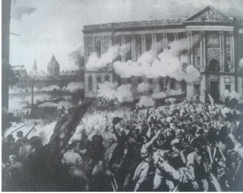
Görsel 1: 1830'da Louvre'a saldırı, o yıllara ait litograf. Artun, A. (2006). Sanat Müzeleri 2, Müze ve Eleştirel Düşünce : 26.

Kamusal ve kamusal alanın tanımları ele alındığında, sanatın kamusal olması, özel bir ailenin kendi koleksiyonunu kamuya açmasından çok, doğrudan halka ait bir sanat anlayışı demektir. Bu doğrultuda; daha önceden başka müzeler kamuya açılmış olsa da, kamusal müze tabiri akla ilk Louvre Müzesini getirir. Çünkü, Fransa'da, halkın 1793 yılında kraliyet koleksiyonuna el koyması sonucu, müze kamunun malı olur. Böylelikle halk, kendine ait olduğunu iddia ettiği bir hazineyi devralmıştır (Artun, 2008) (Görsel 1). Bu dönemde halkın kendi kamusallaşğını yaratmaya çalışması ve bunun sonucunda kamusal müzelerin ortaya çıkışı, sanatı toplumla yakınlaştırmak adına teorik olarak olumlu kabul edilebilir. Habermas da kamusal alan tanımını bu ortamdan beslenerek yapmıştır. Artun ise, sergi ortamları ve müzeleri, zamanla eleştirinin serpiştiği, sanatla ilgili kuramların geliştiği ve Habermas'ın tanımladığı anlamda birer kamusal mekan halini aldığını savunmuştur (Artun, 2008). Burada mekan fiziksel bir alandan ziyade bir iletişim ortamını tanımlamaktadır.