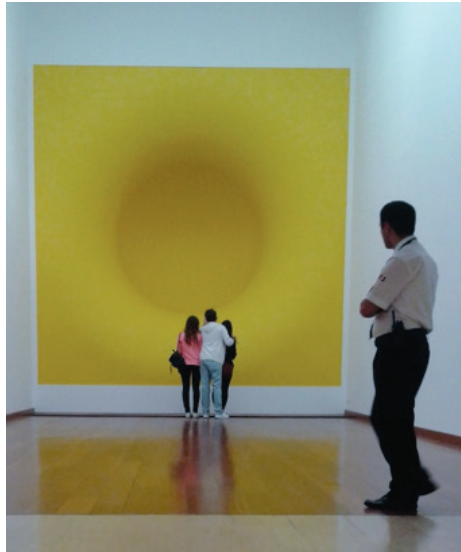
Görsel 3: Anish Kapoor Sergisinden, Sabancı Müzesi, 10 Eylül 2013 – 2 Şubat 2014, İstanbul.