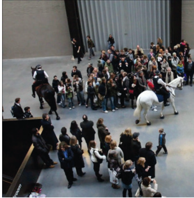
Görsel 4: Tania Bruguera: Tatlin'in Fısıltısı 5, 2008.

New York Modern Sanat Müzesi (MOMA) ve Tate Modern gibi kamusal gelenekleri terk etmeyen müzeler, eleştiri ve tarih alanlarındaki etkinliklerini zenginleştirerek izleyici sayısını artırmaya çalışan müzeler olarak kabul edilebilir. Örneğin Tate Galeri müze kurumunu eleştiren bir çalışmayı (Tania Bruguera: Tatlin'in Fısıltısı 5 isimli çalışması) kendi bünyesinden göstermeyi kabul etmiştir (Görsel 4). Sanatçı, güvenli bir mesafeden görülebilir görüntüleri sunmaktansa, insanların güç dinamiklerini deneyimlemek istemektedir. Serideki en önemli özellik, çalışmanın alacağı seyri belirleyen izleyicinin katılımı olarak tanımlanabilir. Çalışma, izleyicilerin kendi hareketleri doğrultusunda vatandaşa dönüştükleri yerde, polislerin sivil halk üzerindeki gücü ve otoritesinin sınırlarını deneyimlemeyi harekete geçirmektedir (Özgür, 2014).