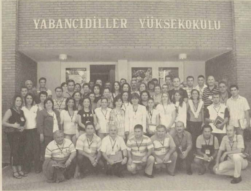
Zümre başkanları Yabancı Diller Yüksekokulu'nda bir araya geldi.

"Buna bağlı olarak uygulama öğretmeni olarak görev alacak İngilizce öğretmeni sayısı bu oranda artacaktır. Programımız kapsamında 4.sınıf öğrencilerimizin staj öğretmenleri olarak görev yapacak tüm İngilizce öğretmenlerimizi buraya davet etmek mümkün olmamıştır. Ancak 4'üncü sınıf öğrencilerimizin bu ders kapsamındaki uygulama (staj) çalışmalarında İngilizce öğretmenlerinin yönlendirici ve değerlendirci olarak programa yardımcı olmaları gerekmektedir. Bu nedenle de işleyiş ve içerik açısından bilgilendirilmeleri gerekmektedir. Bu çalıştay süresince siz zümre başkanlarını bu