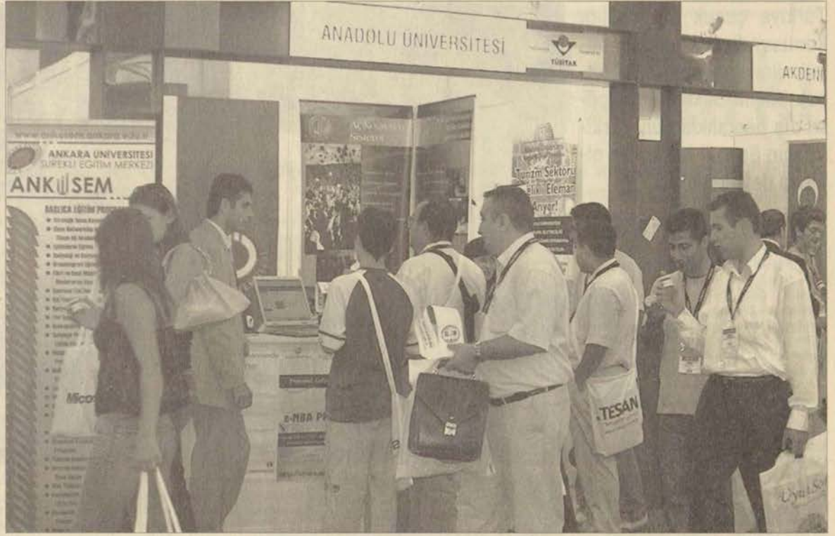
Temsilcilerimiz fuar boyunca toplam beş sunum gerçekleştirirken, AÖF'te e-öğrenme uygulamaları ve internet üzerinden gerçekleştirilen yüksek lisans programları hakkında bilgiler verdiler.