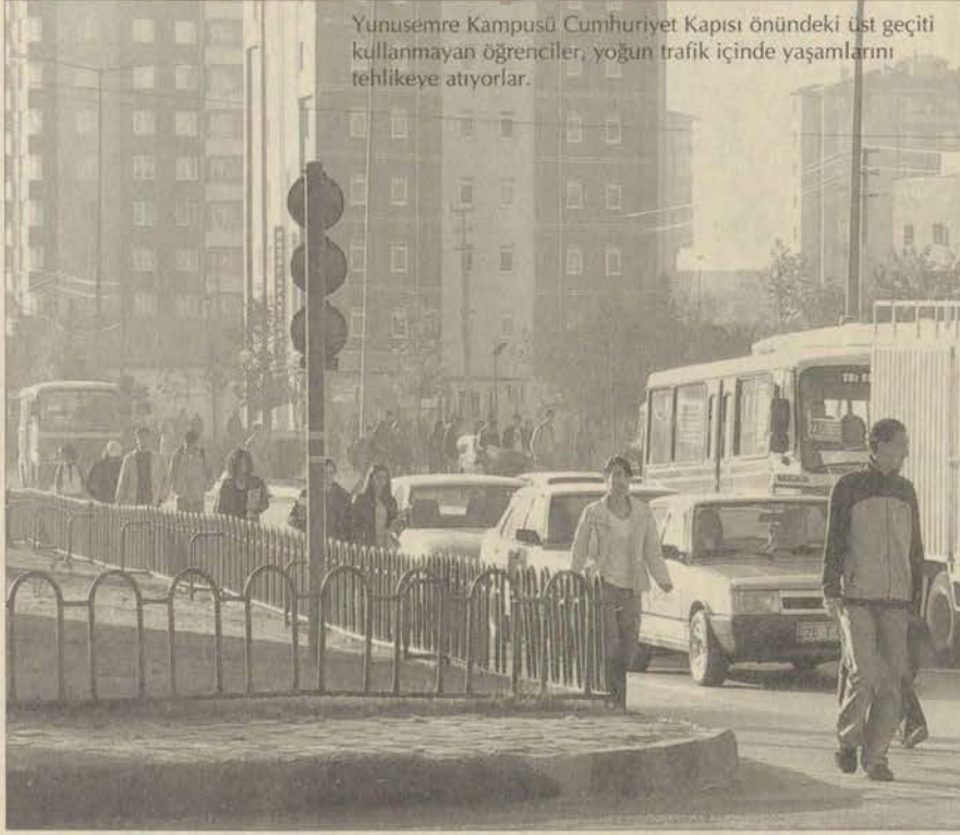
Yunusemre Kampüsü Cumhuriyet Kapısı önündeki üst geçiti kullanmayan öğrenciler, yoğun trafik içinde yaşamlarını tehlikeye atıyorlar.

Önceki yıllara oranla bu yıl yaya kazalarında önemli bir artışın sözkö-