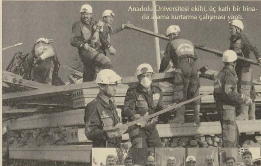
Anadolu Üniversitesi ekibi, üç katlı bir binada arama kurtarma çalışması yaptı.

Yaklaşık iki saat süren tatbikatta, canlı arama kurtarma çalışmaları, yangın söndürme çalışmaları, muharebenin sağlanması, ilk yardım ve ambulans hizmetleri, geçici iskan hizmetleri, ölümlerin tespiti, taşınması ve gömülmesi hizmetleri, telefon hatlarının onarılması, su ve kanalizasyon hatlarının onarılması, elektrik hatları-