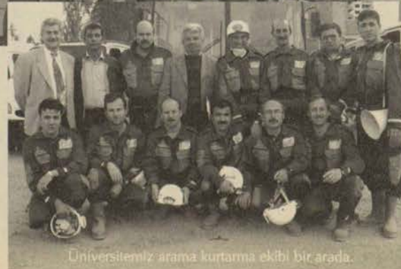
Üniversitemiz arama kurtarma ekibi bir arada.