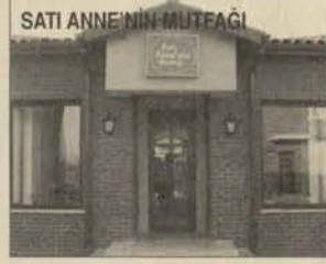
SATI ANNE NİN MUTFAĞI