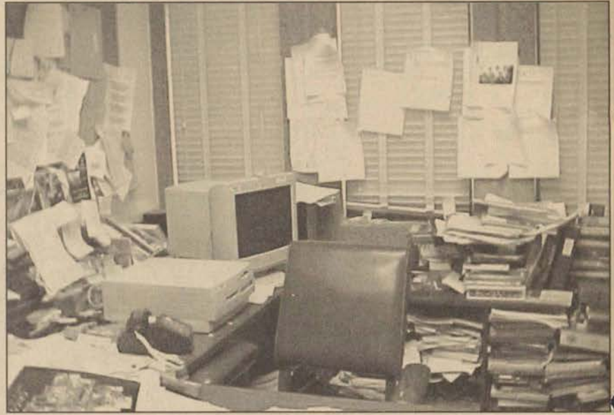
Çok tanıdık gelen böyle ofisler, yeni sistemle tarihe karışacak.

-Bölmenin duvarları hareket edebiliyor. Bu özellik sayesinde taban ve duvarlar arasına yerleştirilen mini bir konferans masasında küçük toplantılar yapılabilir. Eğer ofise elektronik kimliği olmayan biri girse, ekana yansıtılan toplantı notları sistem tarafından gizleniyor.