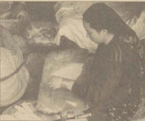
Halk Bilim Araştırmaları Merkezi Eskişehir'in çeşitli bölgelerindeki araştırmalardan derlediği yemekleri kitap haline getiriyor.