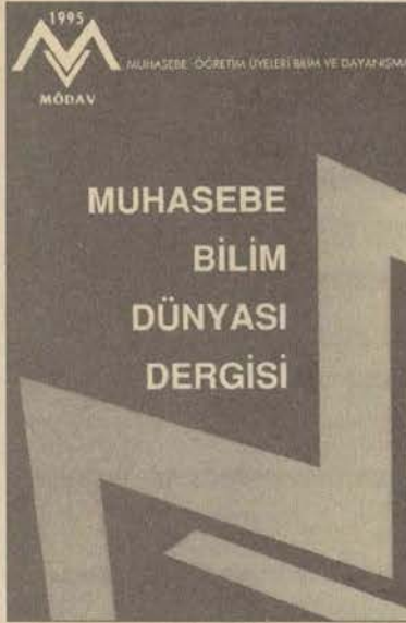
Dergide üniversitemizin öğretim üyeleri çeşitli görevler yürütüyor.