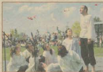
Doğançayır'da Anadolu rüzgar