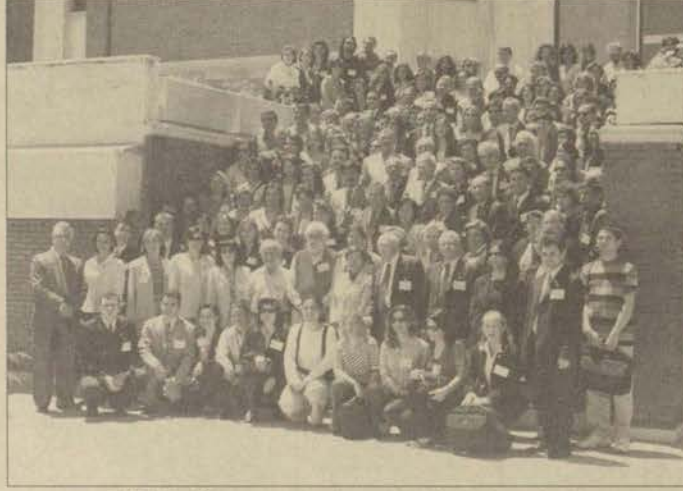
BİHAT, Üniversitemizde üçüncü kez düzenlendi.

"26 yıldır her iki yılda bir düzenli olarak yapılmakta olan toplantının üniversitemizde üçüncü kez düzenlenmekte olması bizler için gurur kaynağı olurken, siz değerli misafirlerimizde de Üniversitemizi daha iyi tanıma fırsatı verecektir. Üniversitemizi hedefimiz, başta eğitim ve bilimsel çalışmalarımız olmak üzere her alanda akademik