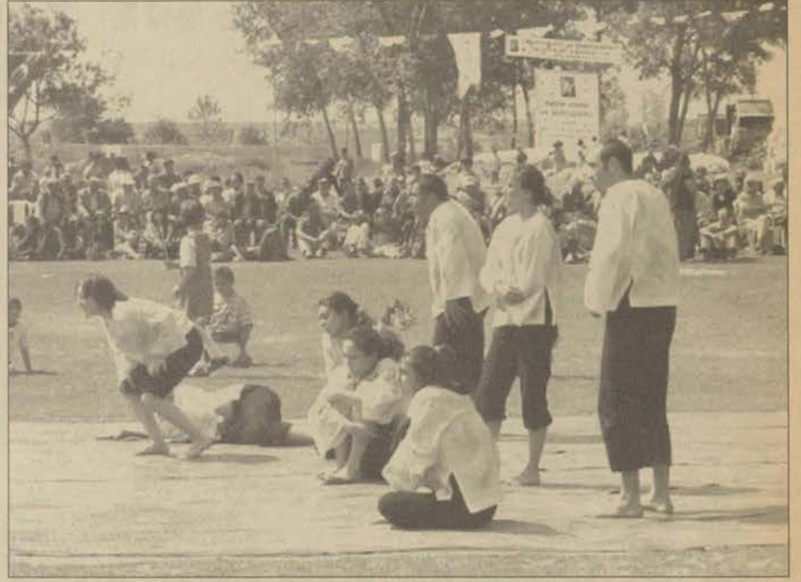
Doğançayır halkı, oyuna büyük ilgi gösterdi.