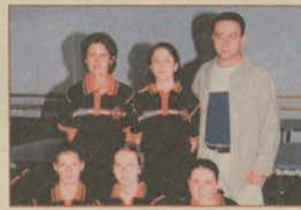
Masa tenisçiler tutulmuyor.