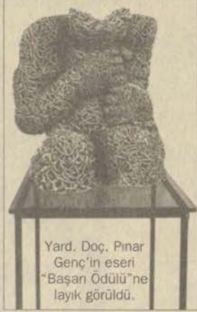
Yard. Doç. Pınar Genç'in eseri "Başarı Ödülü"ne layık görüldü.

Türk plastik sanatçıların seçilmiş çalışmalarını sergilemek, tanıtmak ve güzel sanatlar alanında toplumumuzu eğitmek amacıyla Kültür Bakanlığı tarafından 1939 yılından bu yana düzenlenen ve 535 sanatçının 949 eseriyle katıldığı yarışmada Yard. Doç. Akçaoğlu "Neşe" adlı yağlı boya yapıyla "Başarı Ödülü'nün sahibi oldu.