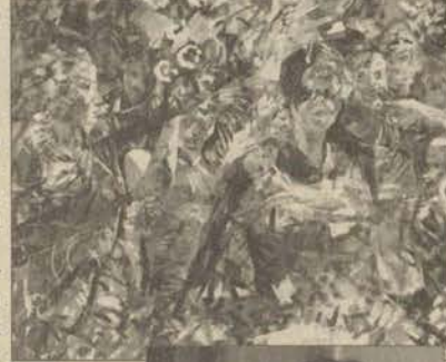
Yard. Doç. Zeliha Akçaoğlu, "Neşe" adlı çalışmasıyla ödül aldı.