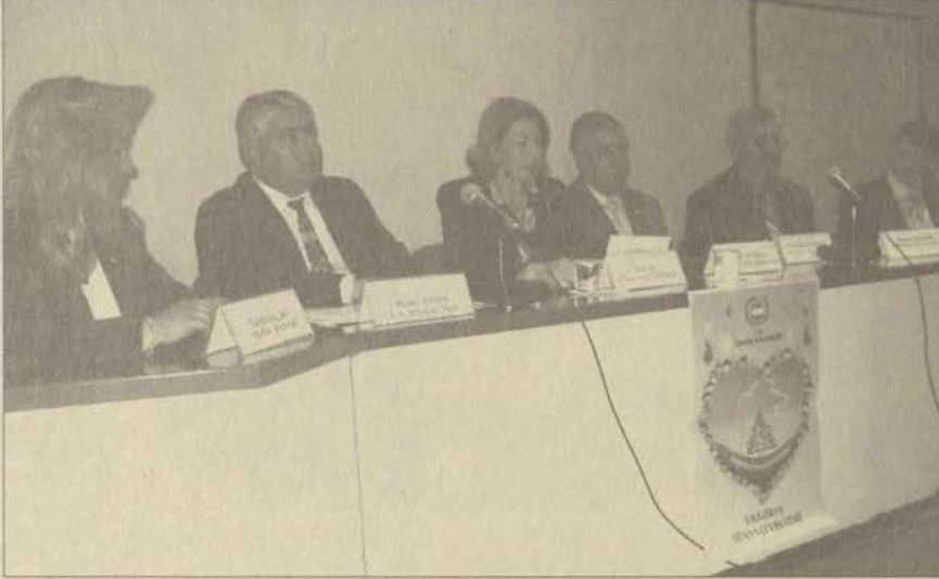
Dünya Çevre Günü dolayısıyla çeşitli bilimsel etkinlikler düzenlendi.