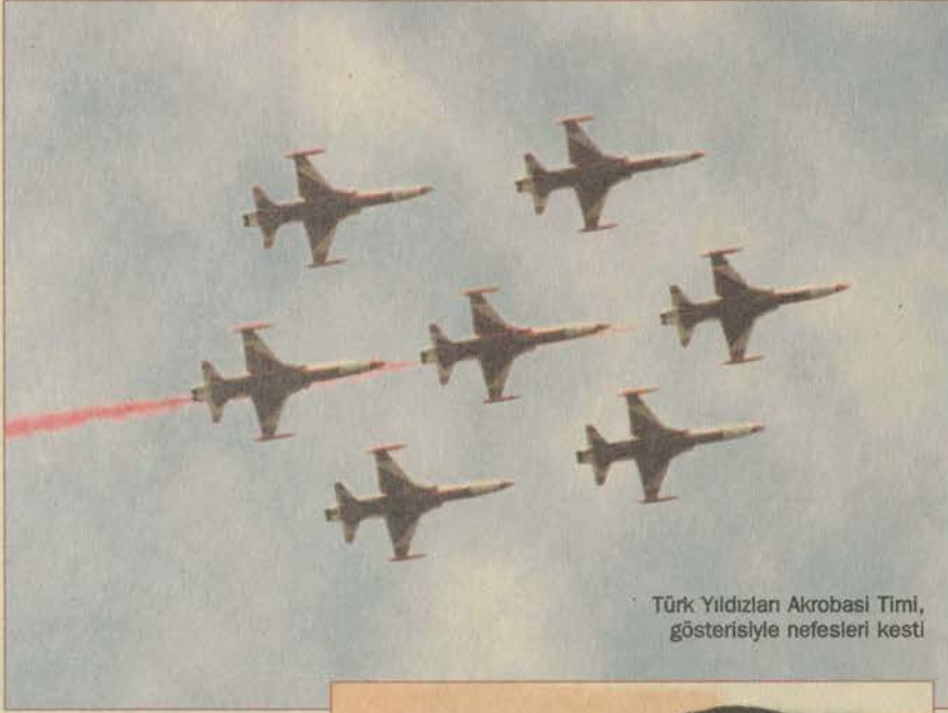
Türk Yıldızları Akrobasi Timi, gösterisiyle nefesleri kesti

Ünlü şarkıcılar Hüseyin Turan, Gülhan ve Yonca Lodi'nin şarkılarıyla eğlence devam ederken, Levent Yüksel'in finalde sahne almasıyla coşku doruğa çıktı. Yaklaşık bir saat sahnede kalan Levent Yüksel, gitar eşliğinde söylediği şarkılarıyla bir şenliğin ardından akıllarda kalan isimlerden birisi oldu.