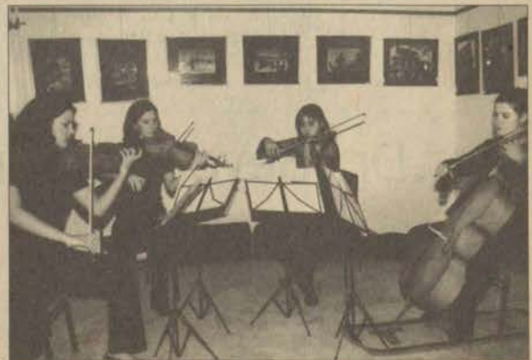
EFSAD'ın yeni binasının açılışında Anadolu Üniversitesi Devlet Konservatuvarı öğrencileri bir konser verdi

Seminerde katılmak isteyenler saat 11.30-19.30 ara-