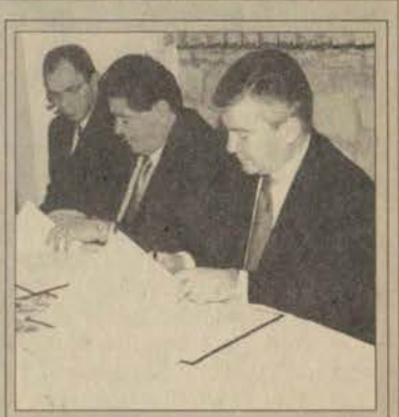
Protokolle Anadolu ve Doğu Akdeniz Üniversiteleri arasındaki işbirliğinin daha da geliştirilmesi amaçlanıyor

yönetim birimleri, kütüphane, okuma salonu, bilgisayar laboratuvarı, tele-konferans salonu ve çeşitli etkinliklere olanak sağlayan bir konferans salonu yer alıyor. Anadolu Üniversitesi kampüslerinden ve Eskişehir'in silvil mimarisinden izler taşıyan tesisler 61 aylık bir çalışmayla tamamlandı.