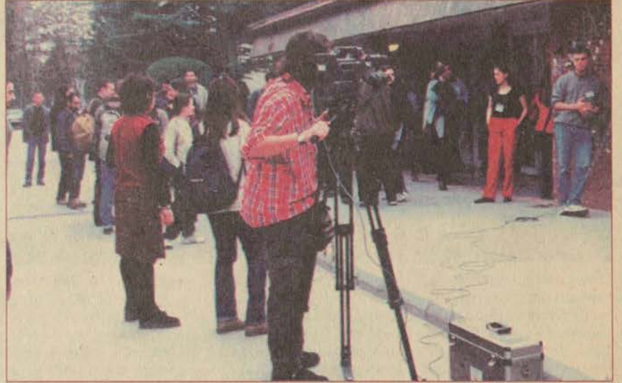
Genç sinemacılar, kampus yaşamını anlatan bir de proje gerçekleştirdiler. Düzenlenen panellerde ise kısa film tartışıldı.

Şenlik kapsamında iki de panel gerçekleştirildi. İlk 14 mart çarşamba günü yapılan "Kısa Filmin Dünyası, Bugünü ve Yarını" konulu pa-