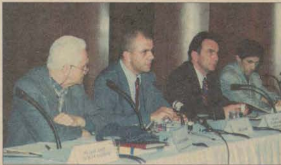
Medyanın Manipülasyon Gücü, üniversitemizde düzenlenen sempozyumda ele alındı.

Sempozyuma yurtiçi ve yurtdışından pek çok bilim insanı ile gazeteci katıldı. Altı oturumda gerçekleşen sempozyumda, medyanın manipülasyon gücü, "Etik İlke ve Değerleri, Medya Etiği", Medyanın Bireysel, Toplumsal, Kurumsal, Kültürel Kimliklerin Oluşması Süreçlerinde Üstlendiği Misyon ve İşlevleri" ile "Kimlik Oluşturma ve Medya" olarak dört ana başlıkta tartışıldı.