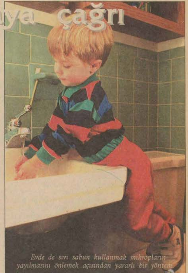
Evde de sıvı sabun kullanmak mikropların yayılmasını önlemek açısından yararlı bir yöntem.