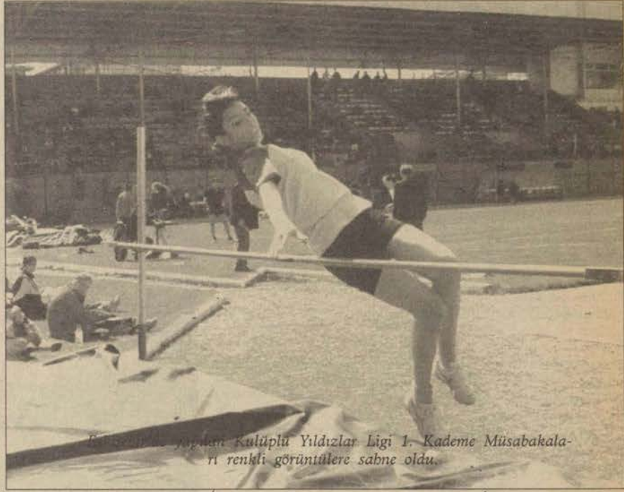
BESYO'nun yaptığı Kulüplü Yıldızlar Ligi 1. Kade-me Müsabakaları renkli görüntülere sabne oldu.

Beden eğitimi öğrencilerinin antrenör olarak görev almasının önemini vurgulayan Yurdadön, "Atletizm yeniliklere açık bir spor da-