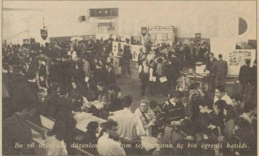
Bu yıl üçüncü kez düzenlenen tanıtım toplantısına üç bin öğrenci katıldı.

Salonda açılan standlarda fakülte ve yüksekokulların öğretim elemanları öğrenci, öğretmen ve velilerin yönelttiği soruları yanıtlarken, eğitim birimleri hakkında bilgi verdiler.