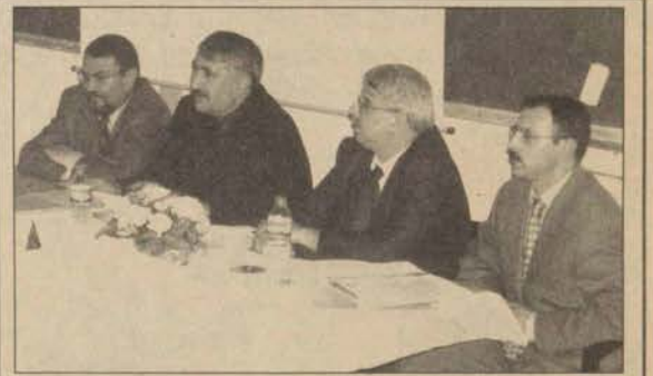
Konuşmacılar, Mali Müşavirlik sürecini anlattılar.

Yapılan klinik denemelerde başarılı sonuçlar alındığını belirten Hallsten, patentli ahnan ürünün çok yakında piyasaya çıkacağını ve bu konuda TBAM'la işbirliği yaptıklarını söyledi.