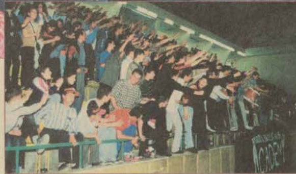
Taraftarın desteği galibiyette önemli rol oynadı.