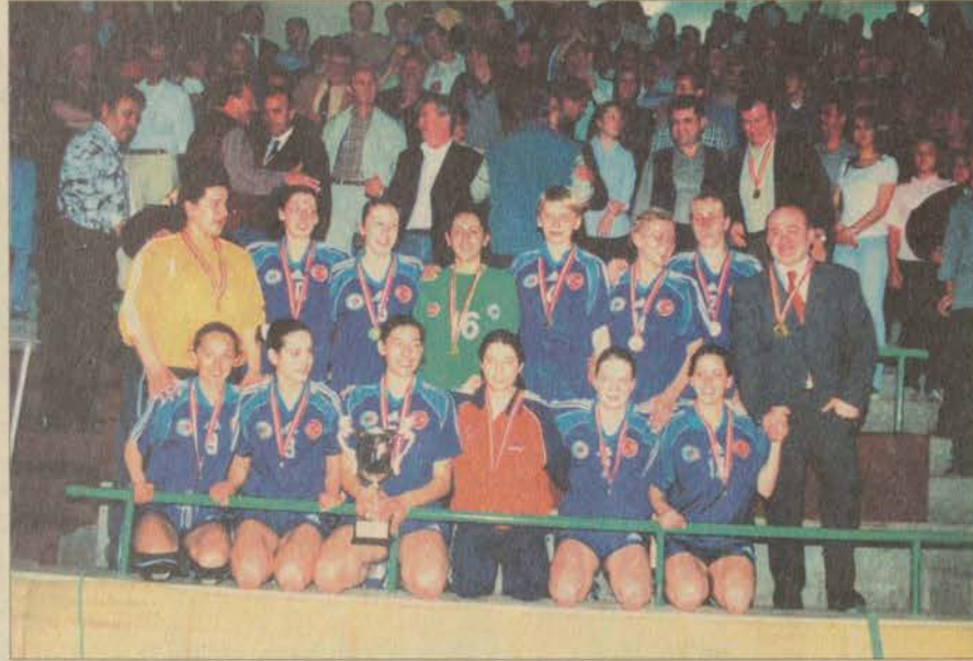
Anadolu Üniversitesi Bayan Hentbol Takımı, Eskişehir'e ilk kez bir Süper Kupa getirmenin sevincini ve gururunu yaşadı.