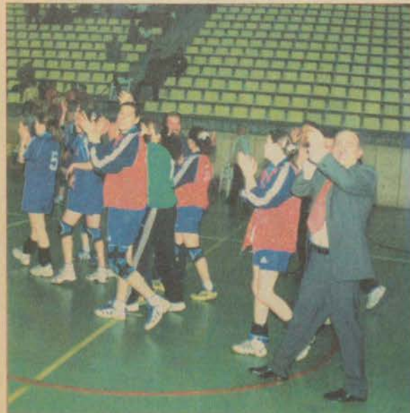
Sporcularımız kendilerini hiç durmadan destekleyen taraftarlara alkışlarla teşekkür ettiler.