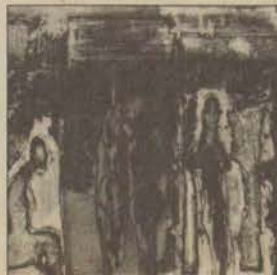
Sergi genellikle metal gravürlerden oluşuyor