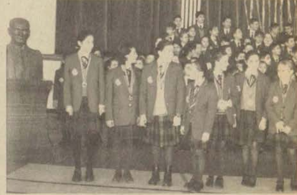
Özel Çağdaş İlköğretim Okulu'nun kızları büyük bir başarıya imza attı.