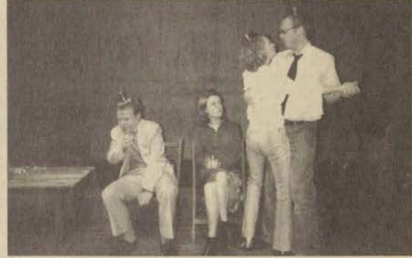
Hollandalı konuk öğrenciler, oyunu kendi yorumlarıyla oynadılar.