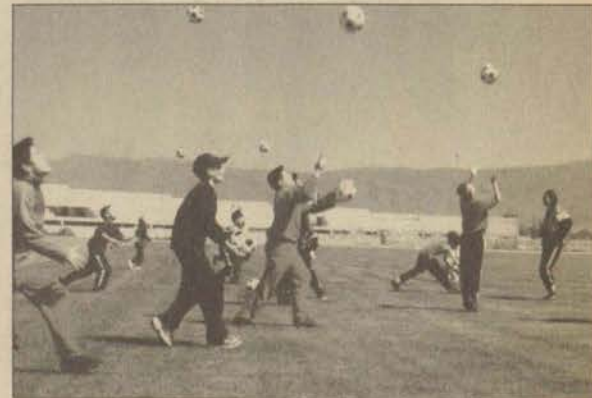
Çocuklar kursta birlikte hareket etmeyi öğreniyorlar.

Küçükkaya, çocuklara birlikte hareket etme, paylaşma duygularını öğreterek yaşam içerisinde onlara bazı kolaylıklar da sağlı-