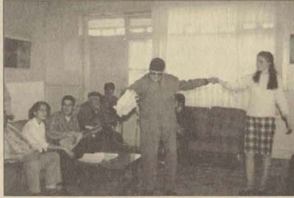
Öğrenciler, yaşlılara hem moral hem de hediye verdiler