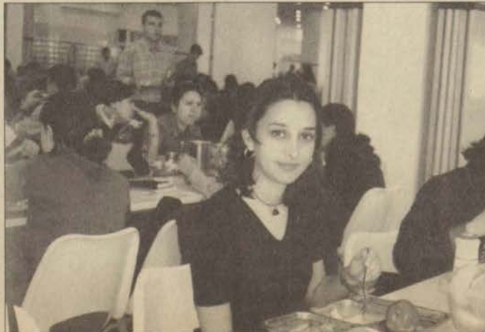
Yemekhane, öğrencilerin tercihlerinde ilk sıralara yükseldi.