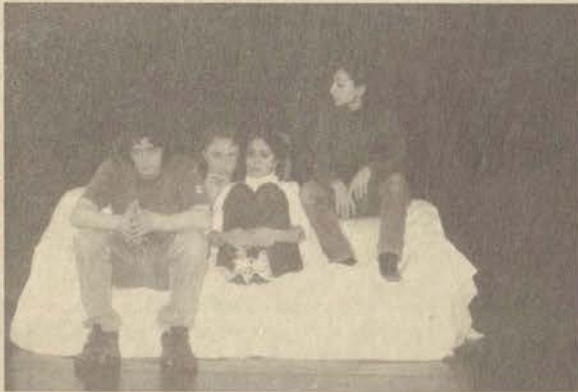
Konservatuvar öğrencileri aynı oyunu önce Hollanda'da sonra da Eskişehir'de oynadılar.