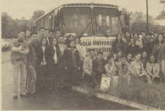
Eğitim Fakültesi öğrencileri ODTÜ'deki konferansı izlediler.