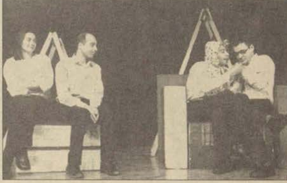
Zamazingo, mahkumlar için sahnelendi.

Mahkumlara moral kaynağı olması açısından ger-