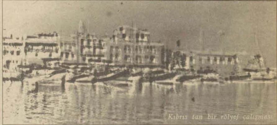
Kıbrıs'tan bir rölyef çalışması

Yüksek Lisans öğrencisi Mesut Öztürk, KKTC Yakın Doğu Üniversitesi tarafından 23-25 Nisan tarihleri arasında düzenlenen 2. Uluslararası Fotoğraf günlerine katıldı.