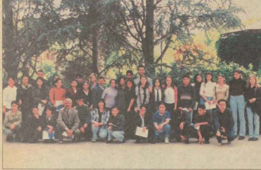
Konuk öğrenciler, Japon Bahçesi'nde hatıra fotoğraf çektirmeyi unutmadılar.

SHÇEK ve Yetiştirme Yurdu'nda kalan öğrenciler Gönüllü Toplumsal Hizmetler Kulübü'nün düzenlediği gezide hem güzel bir gün geçirdiler hem de Anadolu Üniversitesi'ni yakından tanıma olanağı buldular.