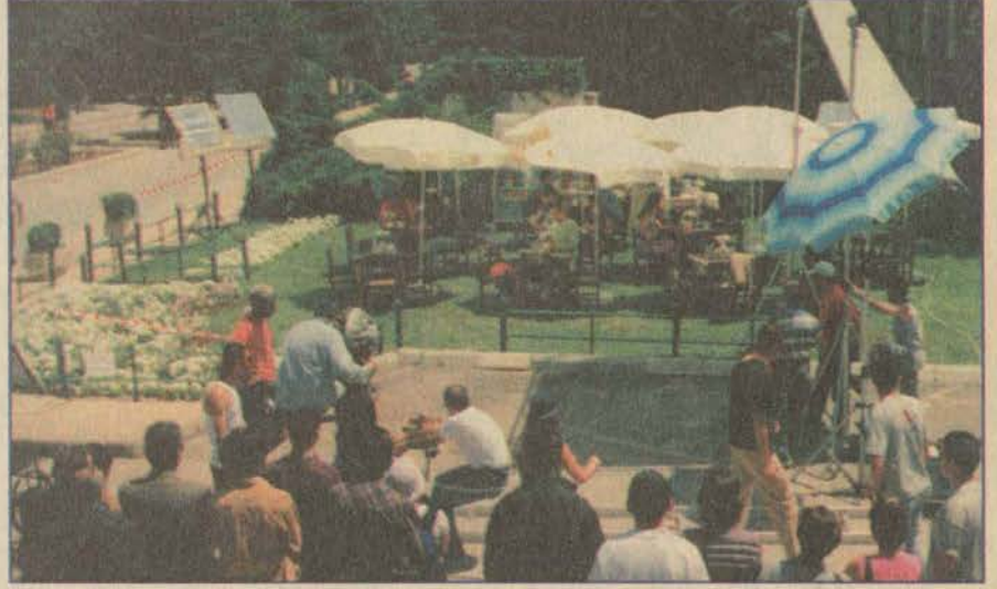
Yunussemre Kampüsü, sahip olduğu özelliklerle çekimler için ideal ortam oluşturuyor.