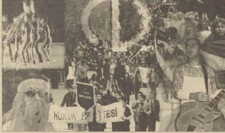
Bahar Şenliği'nde yine coşku, yine eğlence vardı.

Binlerce izleyicinin katıldığı şenlikte çeşitli konserler düzenlendi. Dünyaca Ünlü Kızılordu Korosu ve Türk popunun ünlü ismi Teoman konserlerinde Spor Salonu'nu tıklık tıklım doldurdular. ÖğHalk Dansları Topluluğu da her zamanki gibi büyük beğeni topladı. Teoman, Kurban gibi tanınmış bir çok sanatçının konser verdiği şenlikte, Devlet Konservatuarı da hem şenliğin açılış konseri hem de dinletilerle dinleyici karşısına çıktı. Öğrenciler Şenlik Yürüyüşü'ne her zamanki gibi büyük ilgi gösterdiler.