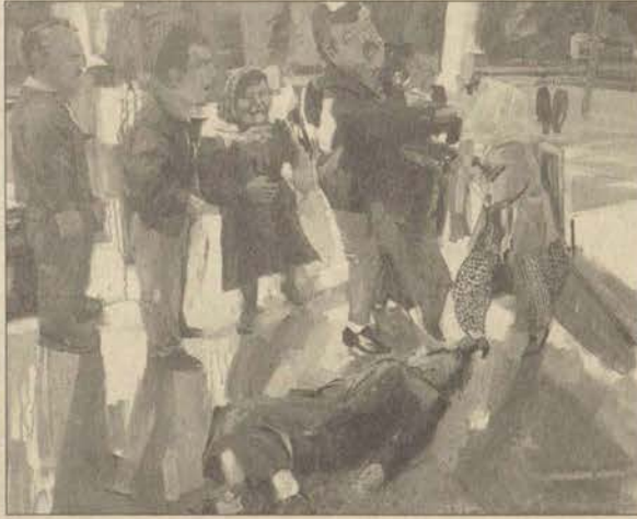
Sergide, Gürsoytrak'ın 16 çalışması yer alıyor.

Gürsoytrak eserlerini gazetelerin üçüncü sayfalarındaki fotoğraflara göre resmettiğini söyleyerek "o çerçevelere gelişen olumsuzluklara karşı resimlerle yanıt verip, yaşam karşısındaki rahatsızlıklarını kendi figüratif anlatım dilimle tuvallere yansıtıyorum" dedi.