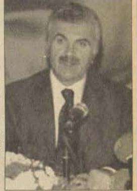
Devlet Bakanı Fikret Ünlü

"Kulübünüz Hentbol Takımı'nın 2000-2001 sezonu Bayanlar Süper Lig Şampiyonu olması son derece sevindirici. Başarılarıyla Anadolu Üniversitesi spor camiası ile Hentbol severlere büyük sevinç yaşatan sporcularımızı kutluyorum. Şampiyonlukta emeği geçen başta siz olmak üzere, tüm yönetici, teknik adam ve taraftarlarınızı şahsım ve teşkilatım adına kutlar; başarılarınızın önmüzdeki yıllarda ve Avrupa liglerinde de devam etmesini dilerim."