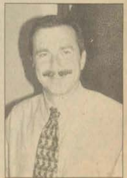
Tepebaşı Belediye Başkanı Ahmet Ataç