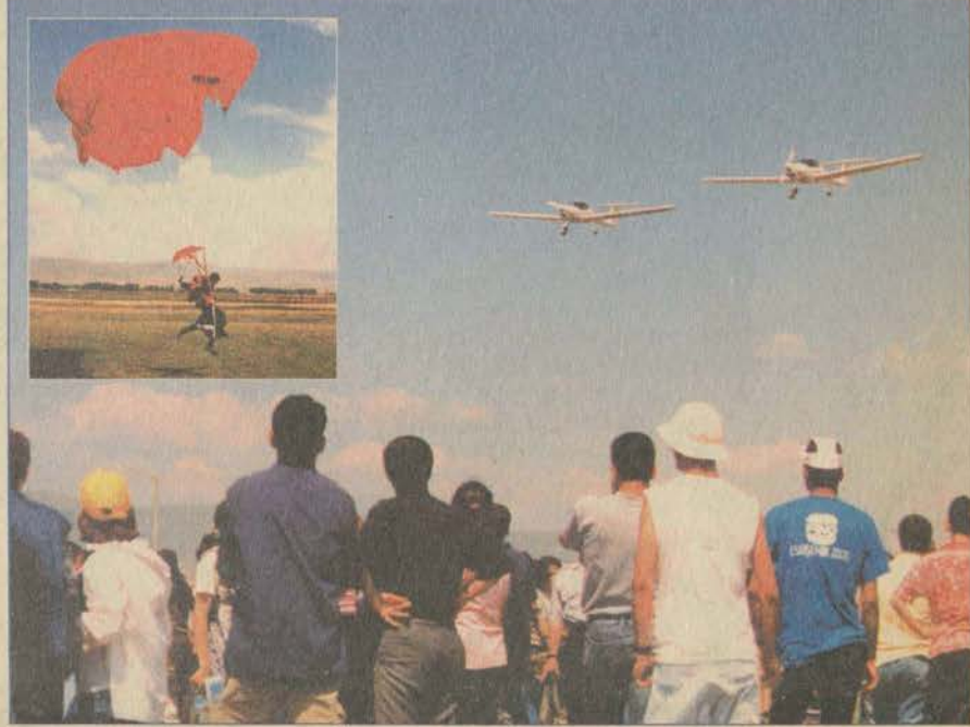
Havacılık Şenliği, Anadolu Üniversitesi'ni yeni bir eğlenceyle buluşturuyor. Şenliği izlemeye gelenlerin başları iki gün boyunca yukarıda olacak.

Şenliğin ikinci gününde ise ünlü isimler izleyicilerle buluşacak. Pop müziğin genç temsilcileri Grup Eylül ve Emre Altuğ'la birlikte Gökhan Tepe de sahne alarak sevilen şarkılarını seslendirecek. Türk Sanat ve halk müziği koroları da konser verecek. BESYO öğrencileri de modern dans gösterisi sunacak.