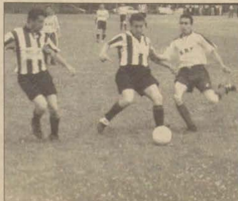
Personel Kupası'nda futbol karşılaşmalarında, üniversitemiz çalışanları kıyasıya mücadele ederek şampiyonluk için uğraş verdiler.