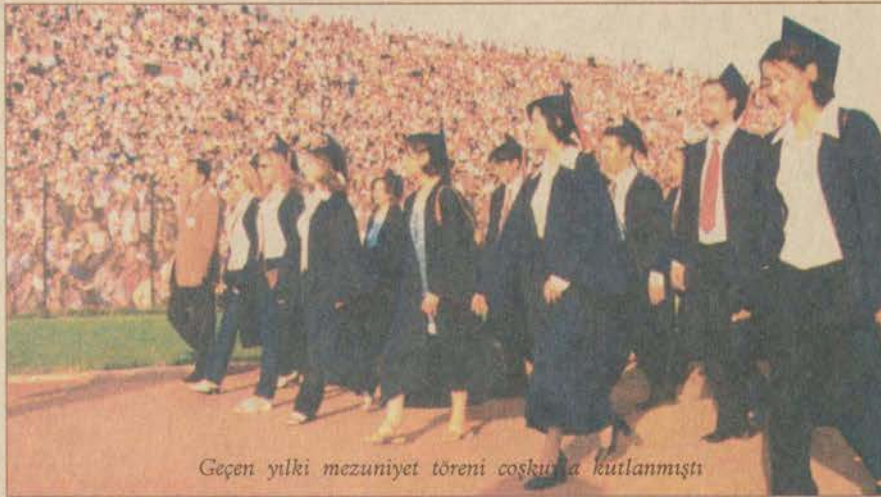
Geçen yılki mezuniyet töreni coşkuyla kutlanmıştır