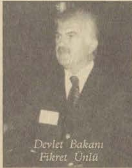
Devlet Bakanı Fikret Ünlü

Devlet Bakanı Fikret Ünlü, toplantı için Anadolu Habere şunları söyledi. "Bilgi paylaşma toplantısının üçüncüsünü düzenliyoruz. Anadolu Üniversitesini ve BESYO tesislerini gördükten sonra bu toplantının burada yapılmasını istedim. Tesisler ve hizmetler son derece etkileyici. Ben daha önce gezdim, gördüm. Federasyon başkanları ve spor teşkilatı buraya olan hayranlıklarını gizleyemiyor. Projeler ile ilgili olarak, bizler bu toplantılar ile Türk sporuna yön vermeye çalışıyoruz. Olimpiyatlar için sporcu kaynağı yaratılmasından