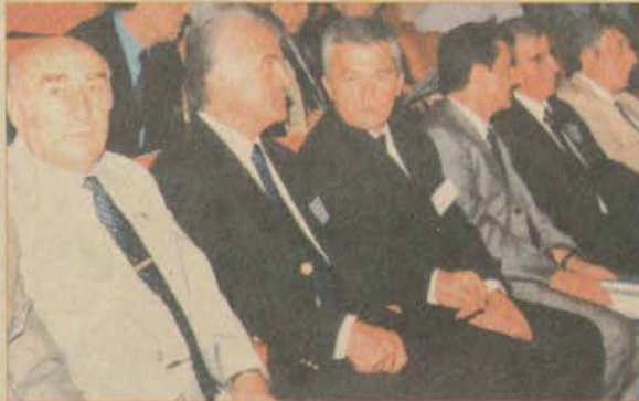
Toplantının açılışına Devlet Bakanı Fikret Ünlü, Eskişehir Valisi Sami Sönmez ve Rektör Engin Ataç da katıldı. Bakan Ünlü, toplantının sonunda bir de değerlendirme konuşması yaptı.

Toplantıda, üniversiteler sporun gelişmesine yönelik olarak geliştirdikleri projeleri anlatırken, federasyonlar da