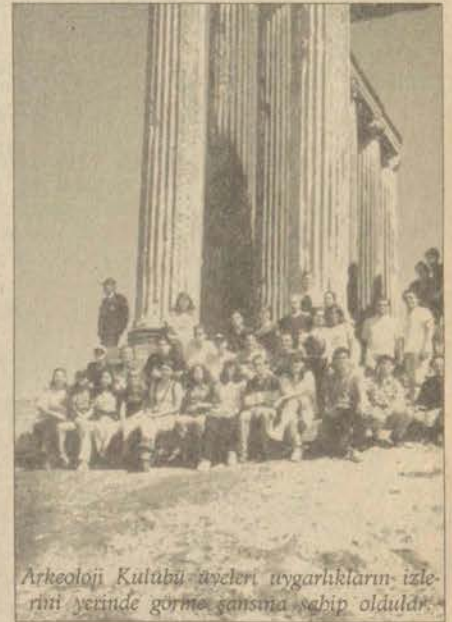
Arkeoloji Kulübü üyeleri uygarlıkların izlerini yerinde görme şansına sahip oldular.