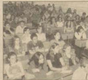
Genç eczacılar konferansa büyük ilgi gösterdi.