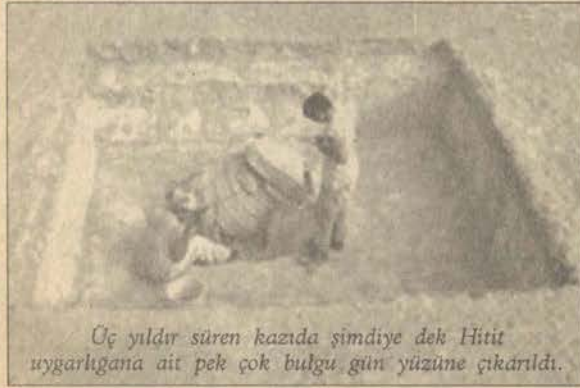
Üç yıldır süren kazıda şimdiye dek Hitit uygarlığına ait pek çok bulgu gün yüzüne çıkarıldı.