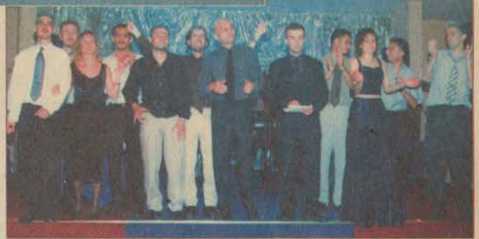
GSF ise mezuniyet balosu için Hayal Kahvesini seçti. (Solda)