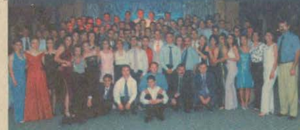
Eskişehir Meslek Yüksekokulu öğrencileri, Mezuniyet Balosu için 29 Mayıs'ta Özgüven Restoran'ta bir araya geldi. (Sagda)