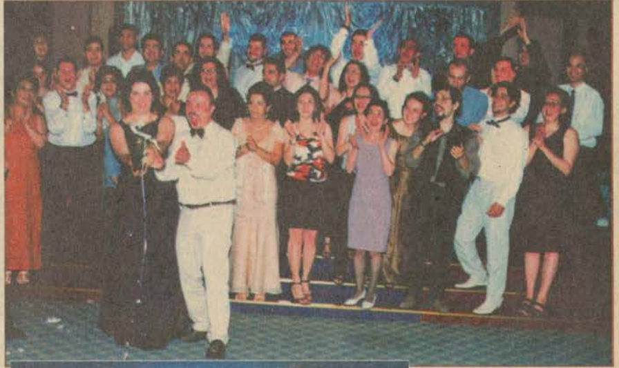
Engelliler Entegre Yüksekokulu öğrencileri mezuniyeti şampanya patlatarak kutladılar. (Üstte)