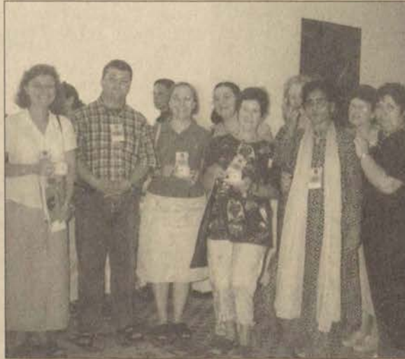
Özel Eğitim Konferansı'na 18 ülkeden bilim insanları katıldı. Konferansta üniversitemiz öğretim üyeleri de vardı.

"Etkileşim ve İşbirliği" konulu konferansta özel gereksinimli bireylerin