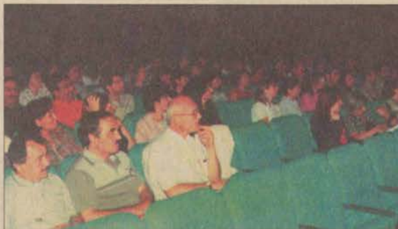
Toplantıya katılan rehber öğretmenler, programın işleyiş hakkında görüşlerini aktardılar.

Anadolu Üniversitesi Açıköğretim Fakültesi İngilizce Öğretmenliği Programı Öğretim ve Sınav Yönetmeliği'nde de değişiklik yapıldı. Gelecek öğretim yılından itibaren geçerli olacak yönetmeliğe göre, Açıköğretim Fakültesinin İngilizce Öğretmenliği programında öğrenim gören öğrencilere, örgün olarak verilen dersler ile uygulama ve staja devam zorunluluğu getirildi. Devam zorunluluğu olan derslerde, üniversite senatosunca kabul edilen haklı ve geçerli nedenlerle de olsa yıllık yüzde 10'dan daha fazla devamsızlık yapan öğrenci o dersten başarısız sayılacak ve yıl sonu bütünleme sınavlarına alınmayacak.