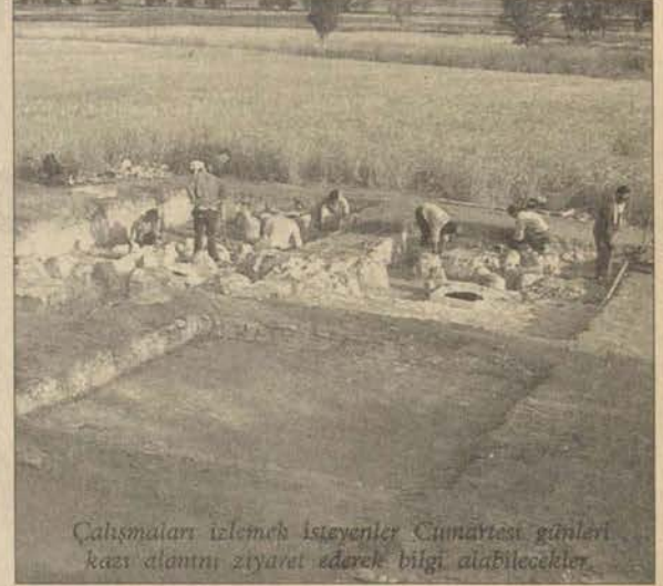
Çalışmaları izlemek isteyenler Cumartesi günleri kazı alanını ziyaret ederek bilgi alabilecekler.