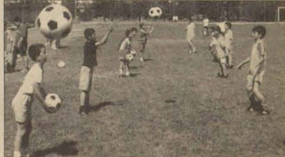
Futbolcu adayları antrenörlerinin gözetiminde çalışmalarını sürdürüyorlar.

Büyük bir ciddiyetle çalışan minikler iyi birer fut-