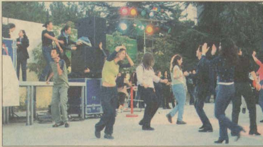
Radyo A, daha önce de iki kez açık hava partisi düzenledi.