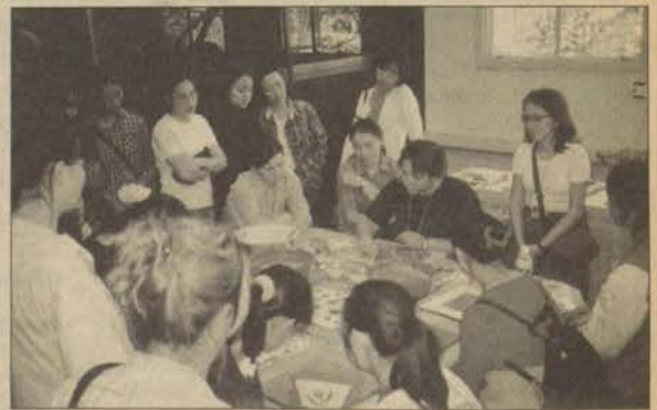
Etkinliğe Anadolu Üniversitesi de ev sahipliği yapmıştı.

"Konferanslarda, ülkelerimizdeki seramiğin dünden