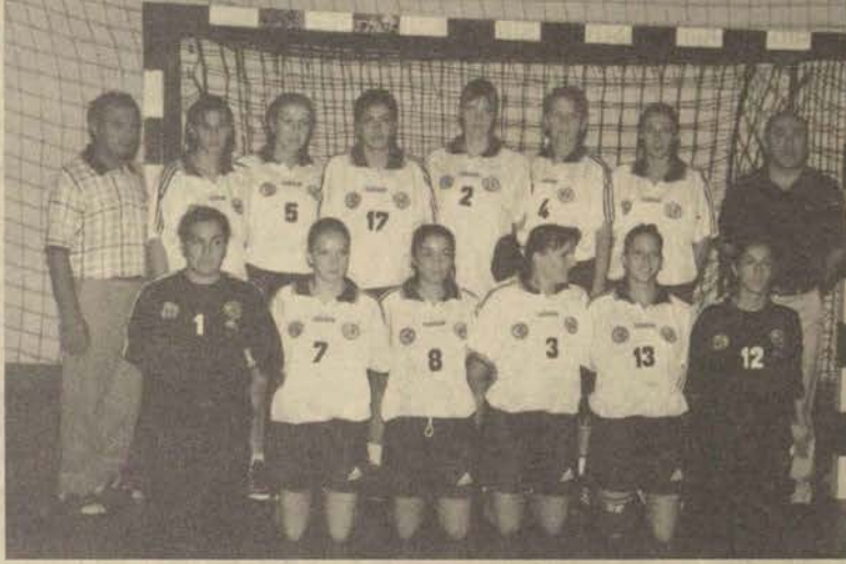
Geçtiğimiz sezonu Süper Lig şampiyonu olarak kapatan bayan hentbolcularımız, aynı başarıyı bu sezon da göstermek istiyorlar.

Avrupa'dan sonra rotasını Lig'e çeviren Bayan Hentbolcülerimiz ligin ilk maçında Kastamonu Gençlik Merkezi'ni 30-18 mağlup etti. Maçın ilk yarısını da 11-5 önde tamamlayan ekibimiz deplasmanda karşılaştığı ve ilk dört için mücadele veren Kastamonu Gençlik Merkezi'ni yenmeyi başararak, geçen sezon şampiyon olduğu liginde, bu sezon da şampiyonluğun en büyük adaylarından biri olduğunu gösterdi. Antrenör Sinan