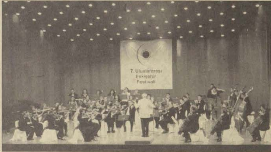
Festivalin kapanış konserini Anadolu Üniversitesi Senfoni Orkestrası verdi.