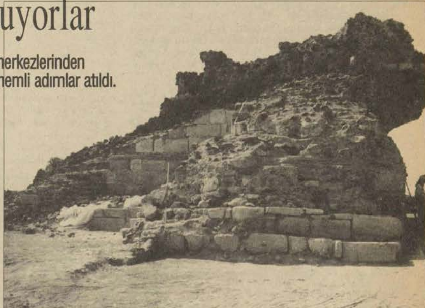
Karacahisar Kalesi'nin eski (sağda) ve yüzey çalışması yapıldıktan sonraki (üstte) durumu.