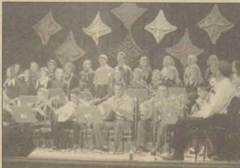
Anadolu Ezgileri Türk Halk Müziği Topluluğu yeni yılın ilk konserini verdi

Anadolu Üniversitesi Müzik Kulübü Anadolu Ezgileri Türk Halk Müziği Topluluğu 4 Ocak çarşamba günü Sine-ma Anadolu'da verdiği konserle yeni yılda ilk kez dinleyicisiyle buluştu. Değişik yörelerden derlenen türkülerin yer aldığı konserde, sonlara doğru konuklar kendilerini eğlenceye kapılarak halay çektiler.