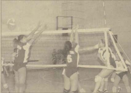
Bayan voleybolcularımız finallere kalmaya kararlı.

Ocak günü kendi evinde oynaması gereken Bolu Gentaş karşılaşması kötü hava koşulları nedeniyle