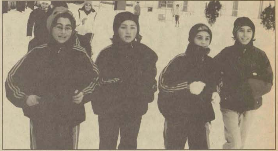
Bayan atletizm takımımız Atatürk Kupası'nda büyük başarı göstererek Türkiye üçüncüsü oldu.