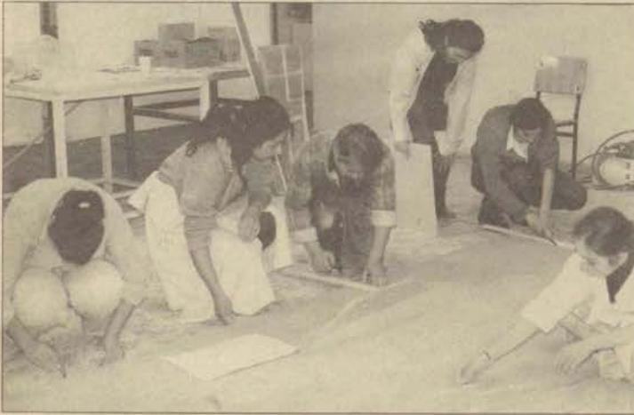
Öğrencilerin çalışması toplam üç panodan oluşuyor.

EEYO son sınıf öğrencileri 1. Ana Jet Üssü için seramik panolar hazırlıyorlar.