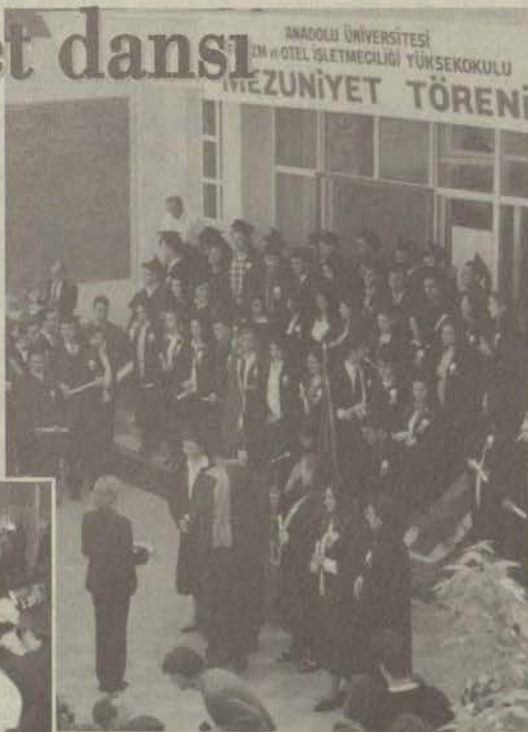
Genç turizmciiler iş hayatına merhaba dediler