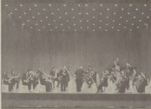
Anadolu Yıldızları 19 kişilik bir ekiple Fransa'da konserler verecek

Anadolu Yıldızları", Konservatuvarın 10. Yıl Etkinlikleri ve Kutlama Programı çerçevesinde ilk kez yurt dışında uluslararası bir Festivalde çalacak. 20-25 Mayıs tarihleri arasında Fransa'nın Belfort kentinde