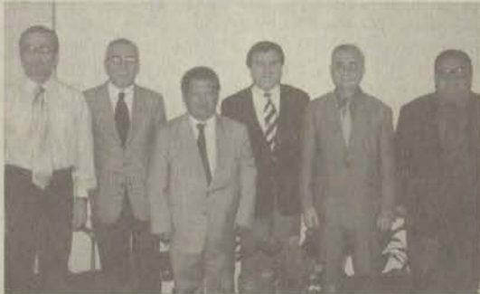
Öğretim üyeleri Çankaya Köşkü'ne çıktılar.

Üniversitemizden bir heyet, Trafik Haftası nedeniyle Çankaya Köşkü'nde düzenlenen törende Cumhurbaşkanı'nın konuğu oldu