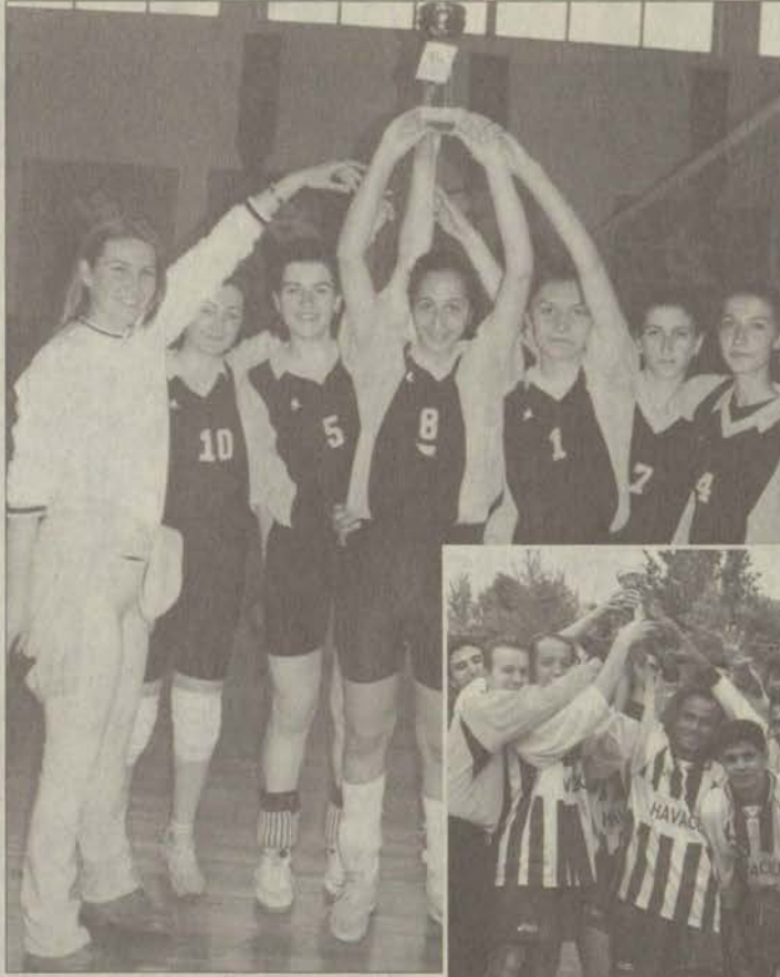
Davullu, uçaklı seyirci desteğini arkasına alan Sivil Havacılık futbolunda şampiyon oldu.

B ahar şenliklerinin birinci ayağını oluşturmuş Spor Şenlikleri'nde şampiyonlar belli oluyor. Bayan voleybol final maçında geçen yılın şampiyonu Eğitim Fakültesi zorlanmadan kupaya yeniden uzandı. Anadolu Üniversitesi Spor Salonu'nda 13 Mayıs 1999 günü Eğitim Fakültesi ile Turizm ve Otel İşletmeciliği Yüksekokulu karşı karşıya geldi. Yoğun bir seyirci kitlesinin izlediği maçta Eğitim Fakültesi 25-11, 25-10 ve 25-19'lük setler sonucunda sahadan 3-0 galip ayrıldı. Bu sonuçla Eğitim Fakültesi geçen yıl kazandığı şampiyonluk kupasını yeniden müzesine götürdü.