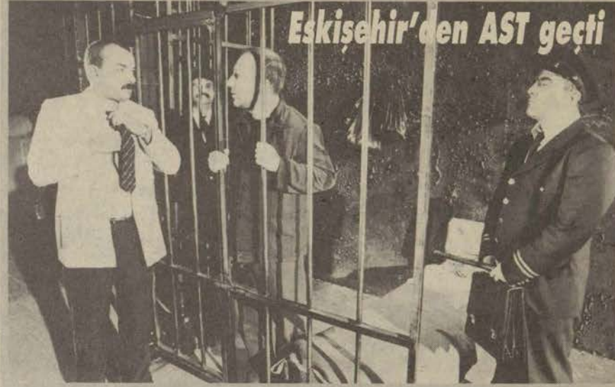
Eskişehir'den AST geçti

Dünya Tiyatrolar Günü Eskişehir'de kutlandı. Anadolu Üniversitesi Devlet Konservatuarı'nın gün nedeniyle çeşitli etkinlikler düzenledi. Bu etkinliklerin ilki konservatuar 1. sınıf seçmeli seramik dersi öğrencileri ve 3. sınıf teknik tasarım dersi öğrencilerinin hazırladıkları mask sergisi oldu. 13:30'da gösteri sanatları öğrencilerinin sunmuş olduğu oyunun ardından stand-up gösterisi ve akşam da William Shakespeare'in Kış Masalı adlı oyunu tiyatro severlerin karşısına çıktı. Dans gösterisiyle renklendirilen oyun büyük ilgi gördü. Gün nedeniyle Eskişehir Tiyatro Kumpanyası, Mehmet Baydur'un yazdığı, Erhan Tu'nun yönettiği Kamyon adlı oyunu Eskişehirli tiyatro severlere ücretsiz sergiledi.