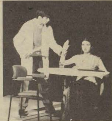
Kulübün "Ders" oyunundan bir görüntü

Benim kendi gözlemim izleyicinin düşünceden uzaklaşmış olması ve genel eğlenceye