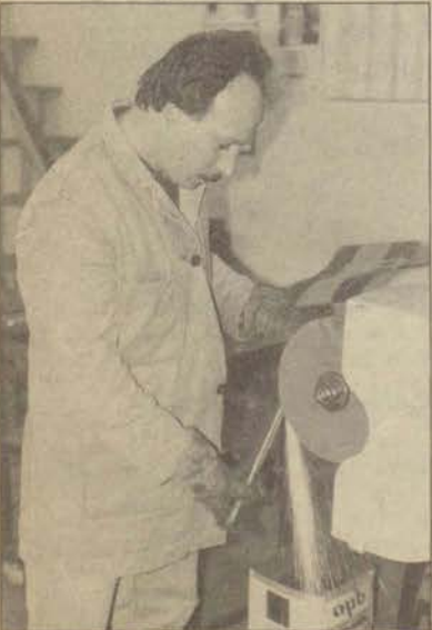
Fırın boya ve kromaj bünyesinde çalışan 12 kişi günde 8 saat üniversiteye hizmet veriyor.

kullanılan eski Meclis binası da 1/1 ölçekli olarak Kartal Zırlı Tugay arazisine yine Anadolu Üniversitesi atölyeleri tarafından inşa edildi. Her ayrıntıyı en ince noktasına kadar ele alan ekip, sekiz ay gibi kısa bir sürede dizi için gerekli olan tüm dekorları tamamladı. Anadolu Üniversitesi'nin sağladığı büyük gelişimde atölyelerde çalışan ve üreten işçilerin de büyük emeği var. Üniversiteye pek çok alanda destek sağlayan atölyeler, üniversitenin en önemli birimlerinden bir tanesi durumunda.