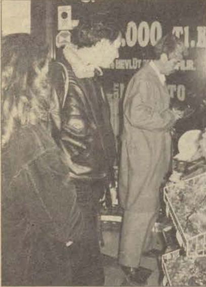
Bu bayram da da şekerçiler revaçta

Herşey rağmen Kurban Bayramınız kutlu olsun.