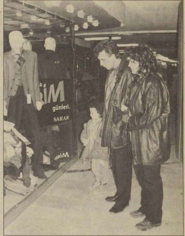
Yaklaşan Kurban Bayramı Eskişehirli vitrinlere yöneltti

Şartların böyle olduğunu görünce Eskişehir'den kaçıp akrabalarla sığınalım, masraftan kaçalım dedik. Bu sefer de karşımıza otobüs ve trenlerde yer sorunu çıktı. 6 Nisan'a kadar hiç bir tren ve otobüste yer kalmadığını öğrendik. Yer bulamadığı için İstanbul'a gidemeyen muhabirimiz de bayramını Eskişehir'de geçirmek zorunda kalıp bayram harçlığından oldu. Bayramda yazı işleri müdürünün artık elinden operiz, Allah yardımcısı olsun. Ama yine de illa ki Eskişehir'den kaçmak isteyenlere TCDD kolaylık göstermiş. Buna göre; 3-12 Nisan tarihlerinde İzmir Mavi, Fatih, Başkent trenlerine ilaveler düzenlenecek. Fakat aldığımız bilgilere göre ek seferler de bile dolanlar olmuş. Bunun üzerine belki otobüslerde de ek sefer vardır umidiyle otobüs terminaline gittik.