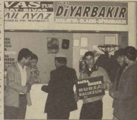
9 Günlük tatil Otobüs şirketlerine yaradı

7 Nisan sabahı her zamanki gibi bayram neşesiyle uyanaca-