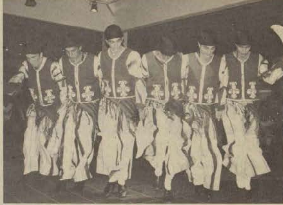
Nevruz gecesinde Halkdansları Topluluğu yöresel oyunlar sundu

Kardeşliğin ve barışın bu gibi etkinliklerle sağlanacağına değişen öğrenciler kendilerini öz vatanlarındaki gibi sıcak bir ortamda hissettiklerini belirttiler.