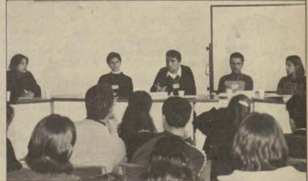
Türkiye üzerine denemeler konulu oturumdan bir görüntü