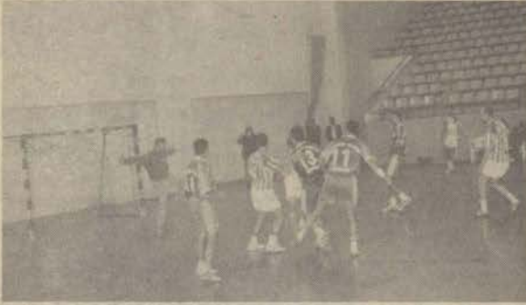
Son maçlarını kaybeden Erkek Hentbolcular artık 2. lige mücadele edecek