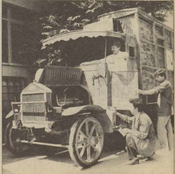
Kurtuluş dizisi için atölyelerimizde üretilen kamyon