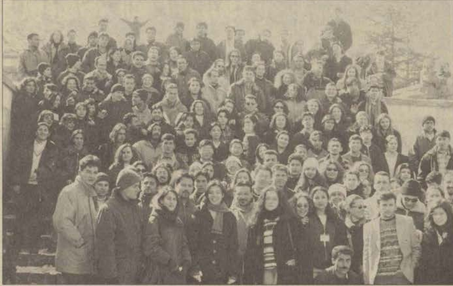
V. Sosyoloji Öğrencileri Kongresi'ne katılan öğrencilerden bir grup

Kongre, başarılı organizasyonu ile dikkat çekerken bunda en büyük pay kuşkusuz, hazırladıkları programın aksadadan yürüyebilmesi için canla başla çalışan Sosyoloji Araştırma Grubu'nun idi. Ortaya çıkan küçük sorunların hemen çözülebilmesi için büyük çaba gösteren evsahibi öğrenciler konuklarını takdirini kazandı. Tamamen bir öğrenci organizasyonu olması da kongreye ayrı bir anlam kattı. Çeşitli üniversitelerden ve farklı görüşlere sahip 500'den fazla katılımcı Türkiye'nin sorunlarını uyar bir ortamda tartıştı, birbirlerini dinlediler ve çözüm önerileri getirdiler. Edebiyat Fakültesi Sosyoloji Bölümü Başkanı Doç. Dr. Nadir Süğür'un "Biz kongreye yalnızca