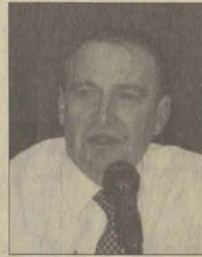
İşadamları Rahmi Koç