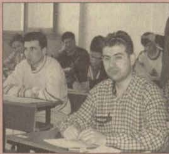
Ara sınavlarda öğrenciler ter döküyor

ve Eskişehir Meslek Yüksekokulu'nda 23-27 Mart tarihleri arasında yapılan sınavlar, Sivil Havacılık Yüksekokulu'nda 27 Nisan-1 Mayıs ve Turizm İşletmeciliği ve Otelciliği Yüksekokulu'nda ise sınavlar 4-8 Mayıs tarihlerinde yapılacak.