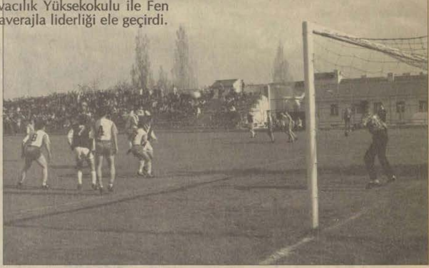
Sivil Havacılık rakibi Fen Fakültesi karşısında ezici bir üstünlük kurdu.