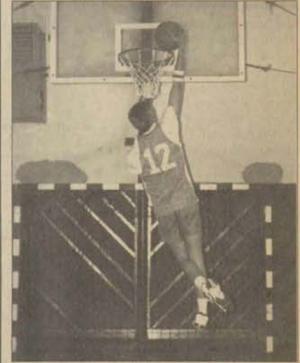
Müh.Mim. zayıf rakibi karşısında zorlanmadı.

İlk maçlarında galibiyetle tanışmayan iki takımın mücadelesinin ilk dakikaları karşılıklı basketlerle geçilirken 5. dakikayı Müh. Mim. 7-5 önde geçti. Devlet Konservatuvarı ilk maça göre çok iyi bir performans gösterirken karşılaşmanın ilk 10. dakikası 10-9 Mühendislik Mimarlık Fakültesinin üstünlüğüyle geçildi. Üst üste basketler kazanan Dev. Kon. 13. dakikada durumu 15-14 yaparak ilk kez öne geçti. 18. dakika 18-18'lik beraberlikle geçilirken son iki daki-