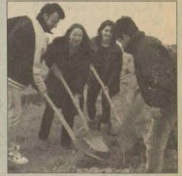
İki Eylül Kampüsü'nde ağaç dikim çalışmalarına öğrenciler de katıldı.