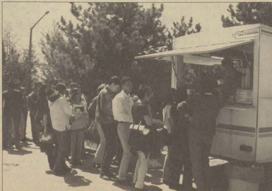
Fast Foot türü yiyeceklerden hoşlananlar için karavan iyi bir fırsat veriyor.

Öğle tatili Anadolu Üniversitesi'nde böyle geçiyor.