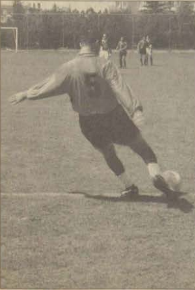
Zorlu maç uzatmalara kaldı.

Futbol Elemeleri A Grubu'na yükselme mücadelesinde gülen taraf uzatmada Güzel Sanatlar Fakültesi'ni 3-2 yenen Eskişehir Meslek Yüksekokulu oldu.