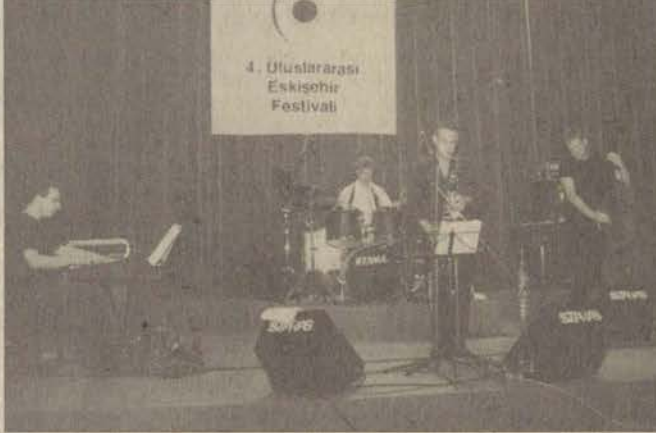
Bill Bruford, grubu Earthworks'le, konser sonunda caz severlerin uzun süren alkışlarının üzerine tekrar sahneye çıktı.

► Earthworks Anadolu Üniversitesi Spor Salonu'nda verdiği konserle izleyenleri büyüledi. Salonu dolduran yüzlerce caz sever, festival yetkililerinden bu konserin tekrar edilmesini istediler.