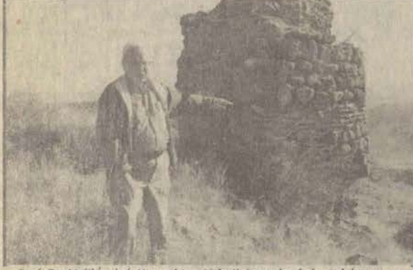
Prof. Dr. Halil İnalçık Karacahisar Kalesi'nin ayakta kalan tek burcunun mimari dokusu hakkında bilgi verdi.

► Tarihçi Prof. Dr. Halil İnalçık, tarihsel kaynaklardaki yer isimlerinin günümüzde kullanılan yer isimleri ile karşılaştırmasını gerçekleştirmek üzere Eskişehir'e geldi.