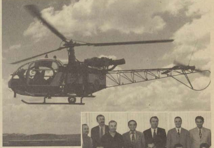
Polis pilot adayları, 8 ay süren eğitimleri boyunca helikopter kullanımını pratik eğitimleriyle tamamladılar.