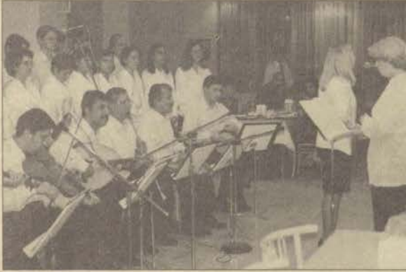
ODTÜ'den gelen konuk öğrencilere TSM korusu bir konser verdi.

► Cumhuriyet'in 75. yıl kutlamaları çerçevesinde Tarih Vakfı'nın düzenlediği "Cumhuriyet, ailenize, kendinize ve çevrenize ne getirdi" adlı yarışmada ilk elliye giren öğrenciler Eskişehir'de Anadolu Üniversitesi Korusu ve Konservatuvar öğrencilerinin verdiği konserle keyifli bir gece geçirdiler.