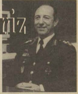
Eskişehir Valisi Ali Fuat Güven 25 Ekim günü düzenlenen Cumhuriyet Yürüyüşü'ne verdiği destek nedeniyle 1. Taktik Hava Kuvvetleri Komutanı Korgeneral Gökalp Yuğnak'a bir plaket sundu.

► Korgeneral Gökalp Yuğnak: Şimdi ne yaparsanız yapın en modern silahları alın, en modern teçhizatları kullanın, ancak bunları kullananın insan olduğunu ve eğitimin önemini unutmamak lazım.