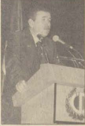
Devlet Bakanı Hasan Gemici

► Devlet Bakanı Hasan Gemici: Atatürk, Cumhuriyeti Türk gençliğine emanet etmiştir. Geleceği hurafelerle değil bilimle karşılayıp, bilimle oluşturmaya çalışacağız.