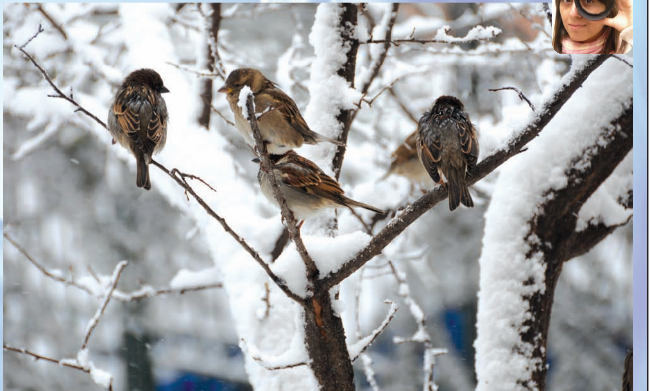
Meltem Türkeri İletişim Bilimleri Fakültesi Basın ve Yayın Bölümü