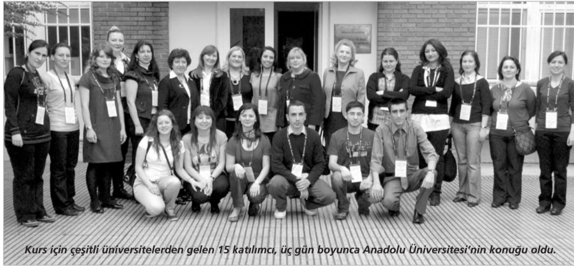
Kurs için çeşitli üniversitelerden gelen 15 katılımcı, üç gün boyunca Anadolu Üniversitesi'nin konuğu oldu.