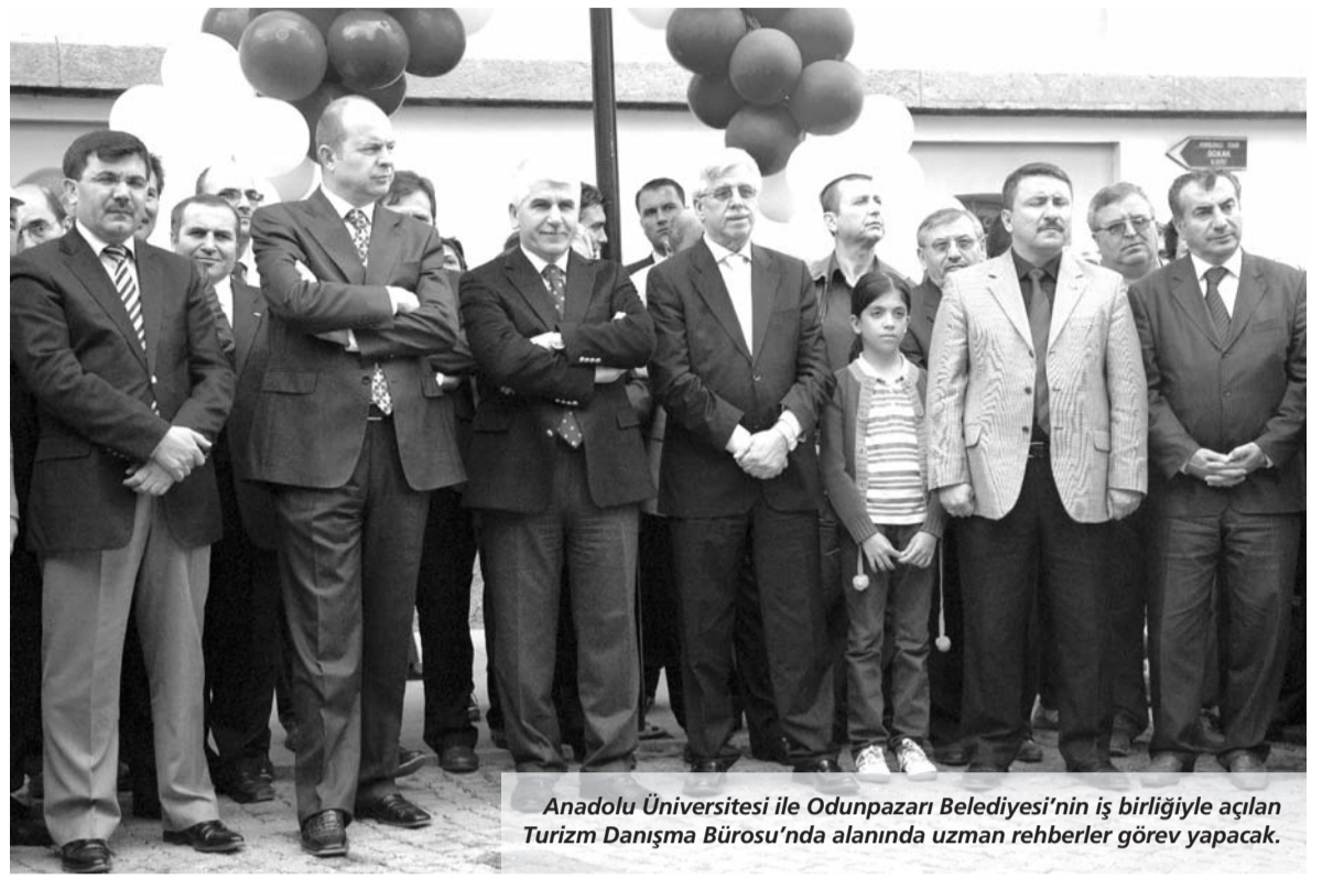
Anadolu Üniversitesi ile Odunpazarı Belediyesi'nin iş birliğiyle açılan Turizm Danışma Bürosu'nda alanında uzman rehberler görev yapacak.