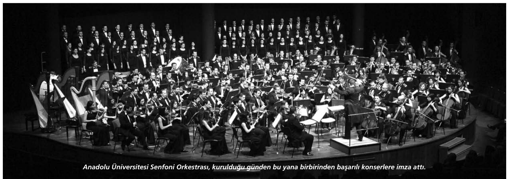
Anadolu Üniversitesi Senfoni Orkestrası, kurulduğu günden bu yana birbirinden başarılı konserlere imza attı.

Sanatçı olmak bir çalgıyı belli bir düzeyde çalıyor olmak değildir. Öyle yapanlara zaten çalgıcı der, kısa süreli bir hayranlık duyar geçeriz. Sanatçı çalgısı üzerindeki yüksek hakimiyetini, yaşantısında güzele, doğruya, mükemmele ulaşma yolunda bir trans aracı olarak kullanır. Salonlarda bizi etkileyen bu trans durumudur. Sanatçı özgürdür, ama özgürlük kavranması, yaşanması, korunması zor bir özelliktir. Sürekli yenilenme, gelişme ister. Objektif olmayı gerektirir. Sanatçı dürüst olmak durumundadır. Algılarımız açık, çevremize ve kendimize yalan söylemeden çalışmalıyız. Doğruyu yapmaktır zordur.