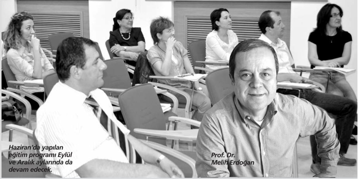
Haziran'da yapılan eğitim programı Eylül ve Aralık aylarında da devam edecek.