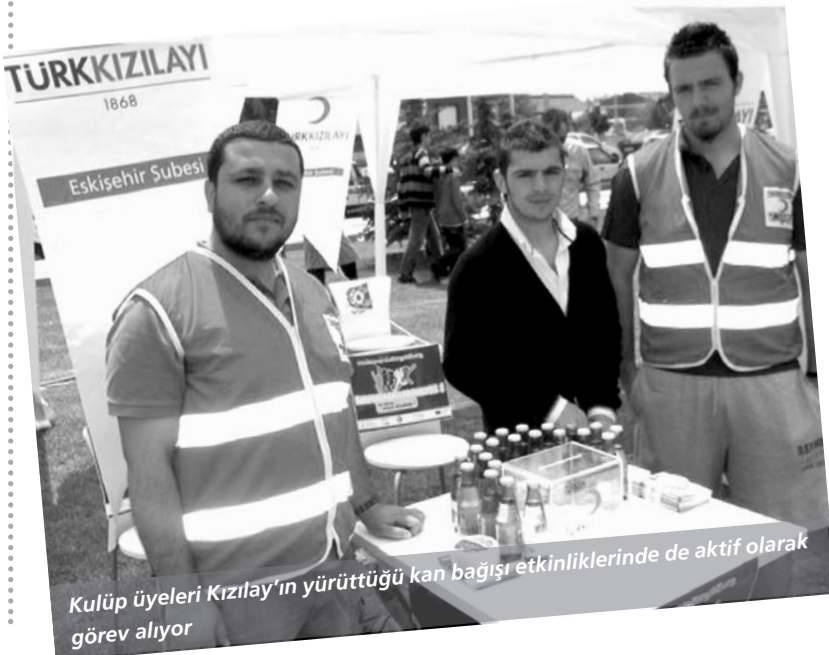
Kulüp üyeleri Kızılay'ın yürüttüğü kan bağış etkinliğinde de aktif olarak görev alıyor