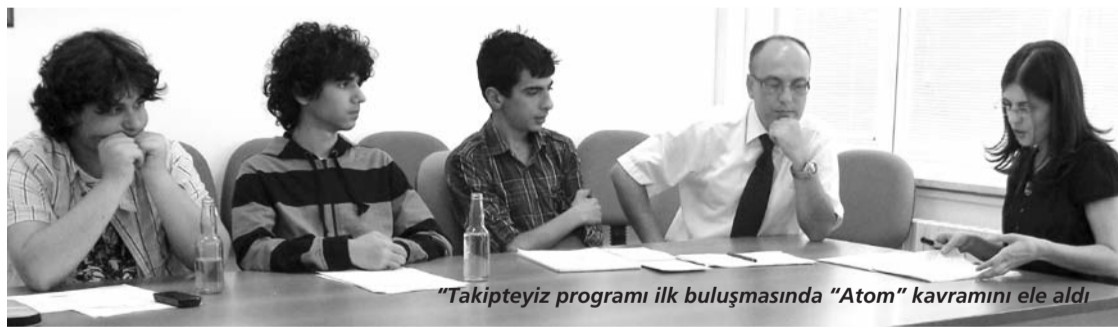
"Takipteyiz programı ilk buluşmasında "Atom" kavramını ele aldı

Yaz programları düzeyinin bir adım üstünde bilgi paylaşımını ve bilimsel deneyim kazandırmayı amaçlayan program sürecinde meraklı ve yetenekli öğrenciler, akademik düzeyde çalışmalar yapan öğretim üyelerinden ilgi alanları doğrultusunda bilgi ve deneyim