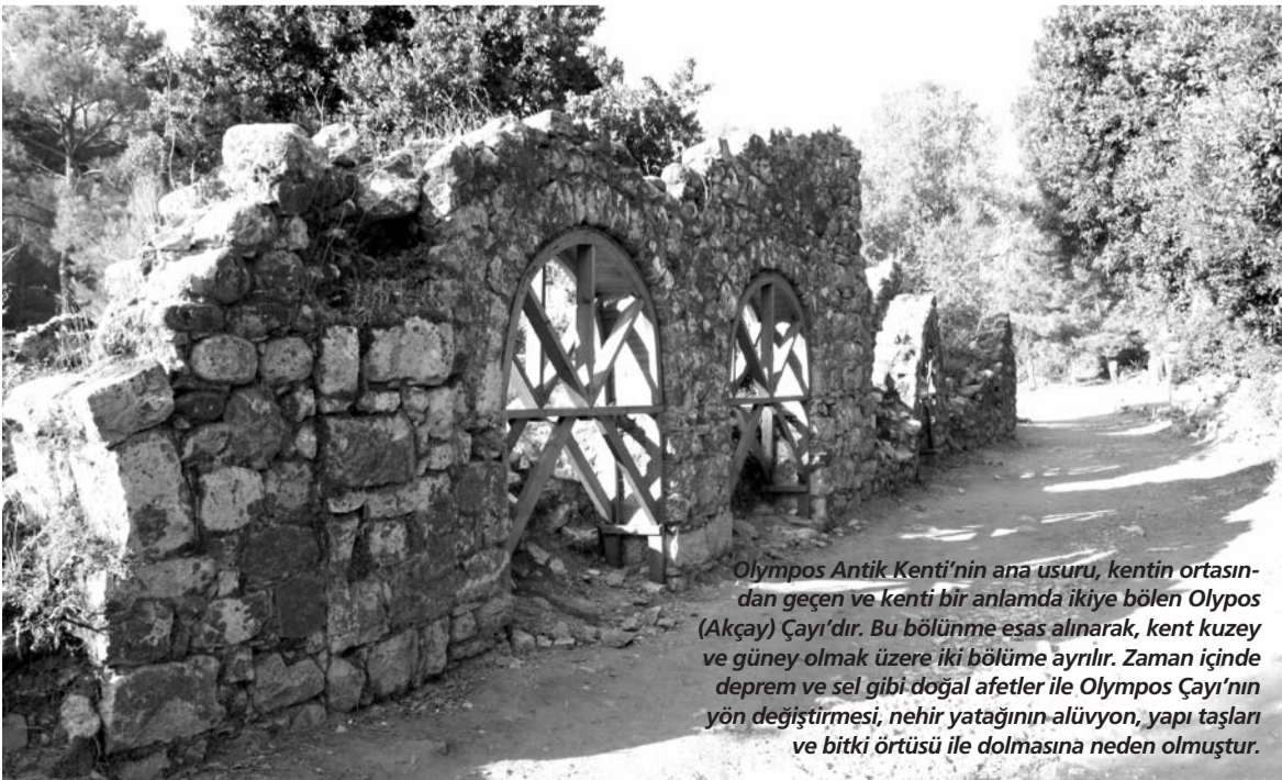
Olimpos Antik Kenti'nin ana usuru, kentin ortasından geçen ve kenti bir anlamda ikiye bölen Olypos (Akçay) Çayı'dır. Bu bölünme esas alınarak, kent kuzey ve güney olmak üzere iki bölüme ayrılır. Zaman içinde deprem ve sel gibi doğal afetler ile Olypos Çayı'nın yön değiştirmesi, nehir yatağının alüvyon, yapı taşları ve bitki örtüsü ile dolmasına neden olmuştur.

2011 yılı ödülleri yeni eğitim-öğretim yılı açılış töreninde sahiplerini bulacak.