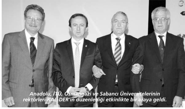
Anadolu, İTÜ, Osmangazi ve Sabancı Üniversitelerinin rektörleri KAL-DEK'in düzenlediği etkinlikte bir araya geldi.