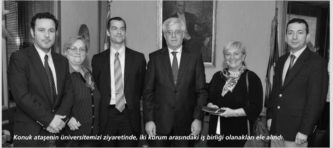
Konuk ataşenin üniversitemizi ziyaretinde, iki kurum arasındaki iş birliği olanakları ele alındı.