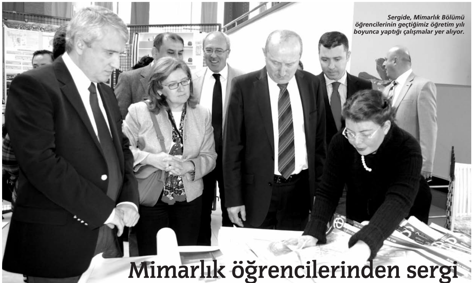
Sergide, Mimarlık Bölümü öğrencilerinin geçtiğimiz öğretim yılı boyunca yaptığı çalışmalar yer alıyor.