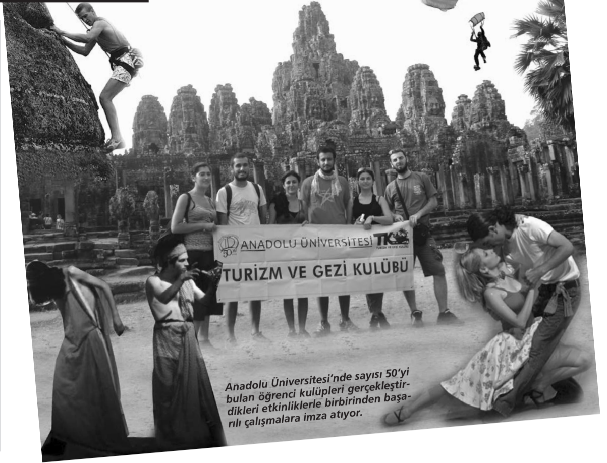
Anadolu Üniversitesi'nde sayısı 50'yi bulan öğrenci kulüpleri gerçekleştirdikleri etkinliklerle birbirinden başarılı çalışmalarına imza atıyor.