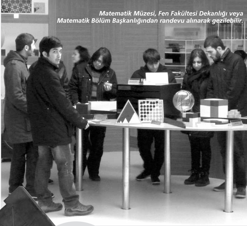
Matematik Müzesi, Fen Fakültesi Dekanlığı veya Matematik Bölüm Başkanlığından randevu alınarak gezilebilir.

Bu arada, bölümümüz Matematik Kavramlar Tarihi dersinde matematiğin tarihsel gelişimini anlatırken Osmanlı'da matematik konusu da söz konusu olmaktadır. Bu konuda olumlu ya da olumsuz çok şey söylendiğini biliyoruz. Biz bu konunun, en iyi o dönemde yazılmış matematik kitapları ile ortaya konulabileceği düşündük. Bu düşünceyle Osmanlıca matbu ya da el yazması olarak oluşturduğum antika matematik kitapları koleksiyonumun da hem salona renk katacağı ve hem de biraz önce bahsettiğim gibi o dönem matematiği hakkında ziyaretçilerimizi bilgilendireceği için bu kitapları da salonda sergilemek istedik. Ayrıca matematikle ilişkisi nedeniyle mekanik ya da elektronik hesap makinelerinin de salona renk katacağını düşündük. Bu arada sadece Osmanlı matematiği hakkında bilgi vermek kadar, bugün ülkemizde