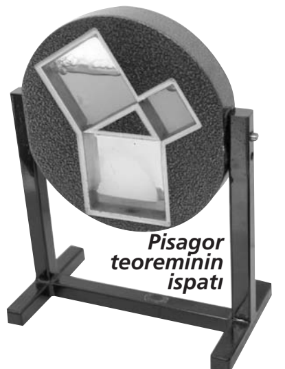
Pisagor teoreminin ispatı

Salonu ziyaret eden 50 kişilik bir gruptan bir kişi matematiğe anlamaya ve sevmeye başlarsa salon ancak o zaman amacına ulaşmış olacaktır.