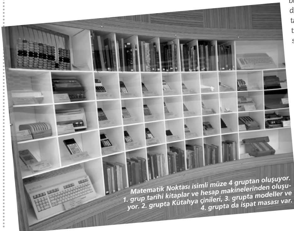
Matematik Noktası isimli müze 4 gruptan oluşuyor. 1. grupta tarihi kitaplar ve hesap makinelerinden oluşuyor. 2. grupta Kütahya çinileri, 3. grupta modeller ve 4. grupta da ispat masası var.