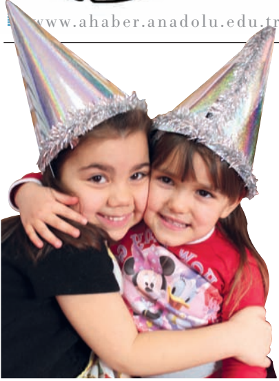
Üniversitemiz Kreş ve Gündüz Bakım evinde yeni yıl coşkusu renkli görüntülere sahne oldu.