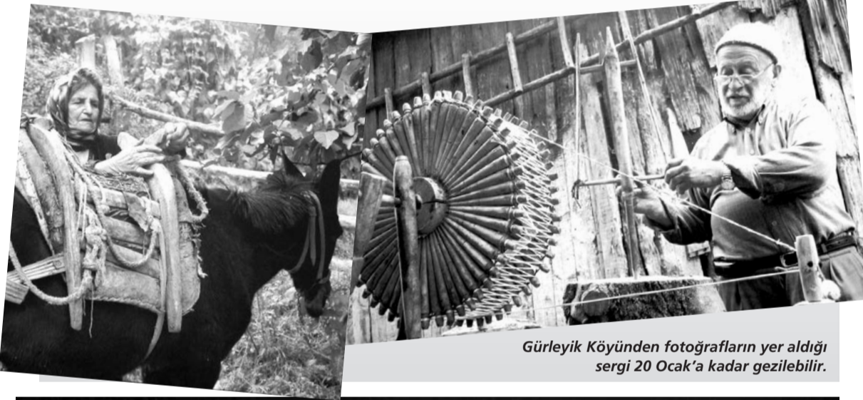
Gürleyik Köyünden fotoğrafların yer aldığı sergi 20 Ocak'a kadar gezilebilir.