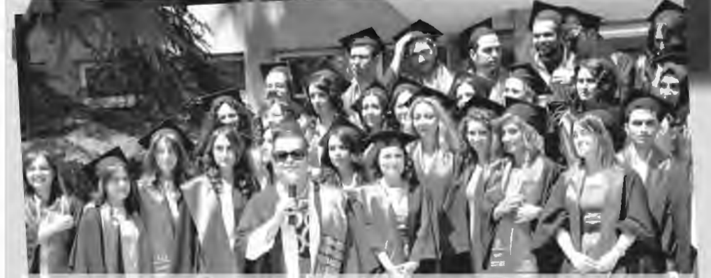
ECZACILIK FAKÜLTESİ 2011-2012 yılı mezuniyet heyecanını fakülte bahçesinde yapılan törenle, fakülte öğretim görevlileri, mezun olan öğrenciler ve aileleri ile paylaştı.