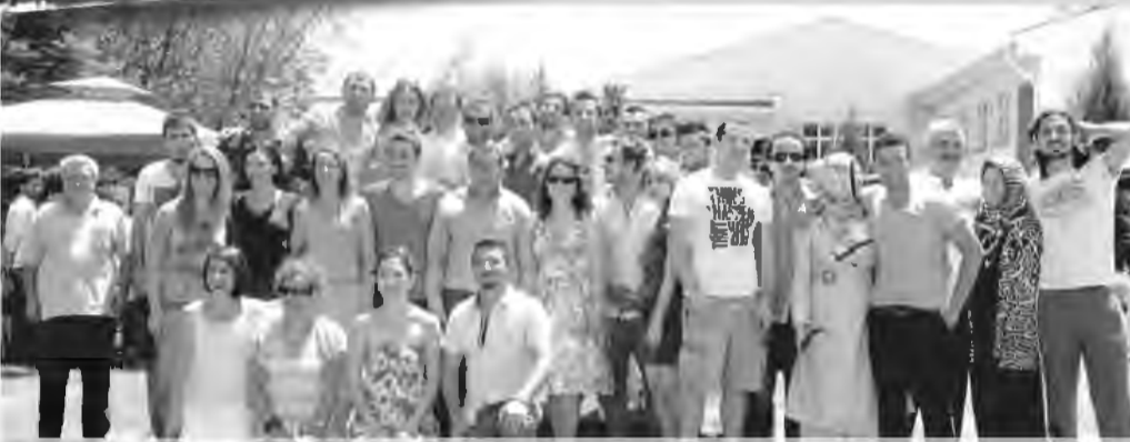
BEDEN EĞİTİMİ SPOR YÜKSEKOKULU tarafından 2011-2012 yılı mezun öğrencileri için düzenlenen mezuniyet töreninde, aileler çocuklarının başarısına ve mutluluğuna ortak oldu.