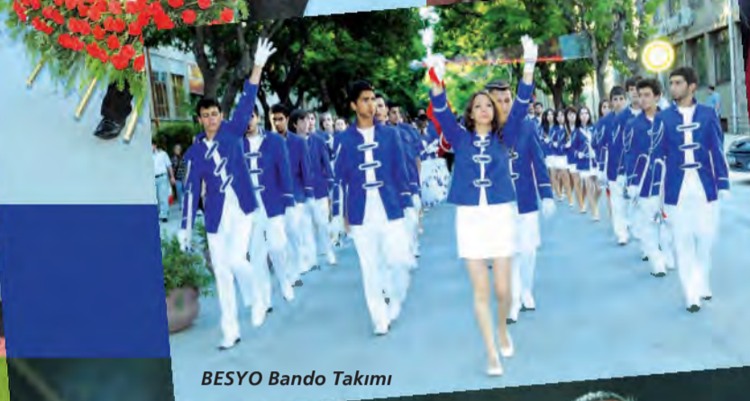
BESYO Bando Takımı