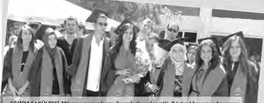
EĞİTİM FAKÜLTESİ 30'uncu mezunlarını ikramlarla yolcu etti. Dört yıl boyunca havasını soludukları fakülteden ayrılmanın burukluğunu yaşayan mezunlar, aileleri ve öğretim elemanlarıyla güzel bir gün geçirmenin keyfini yaşadı.