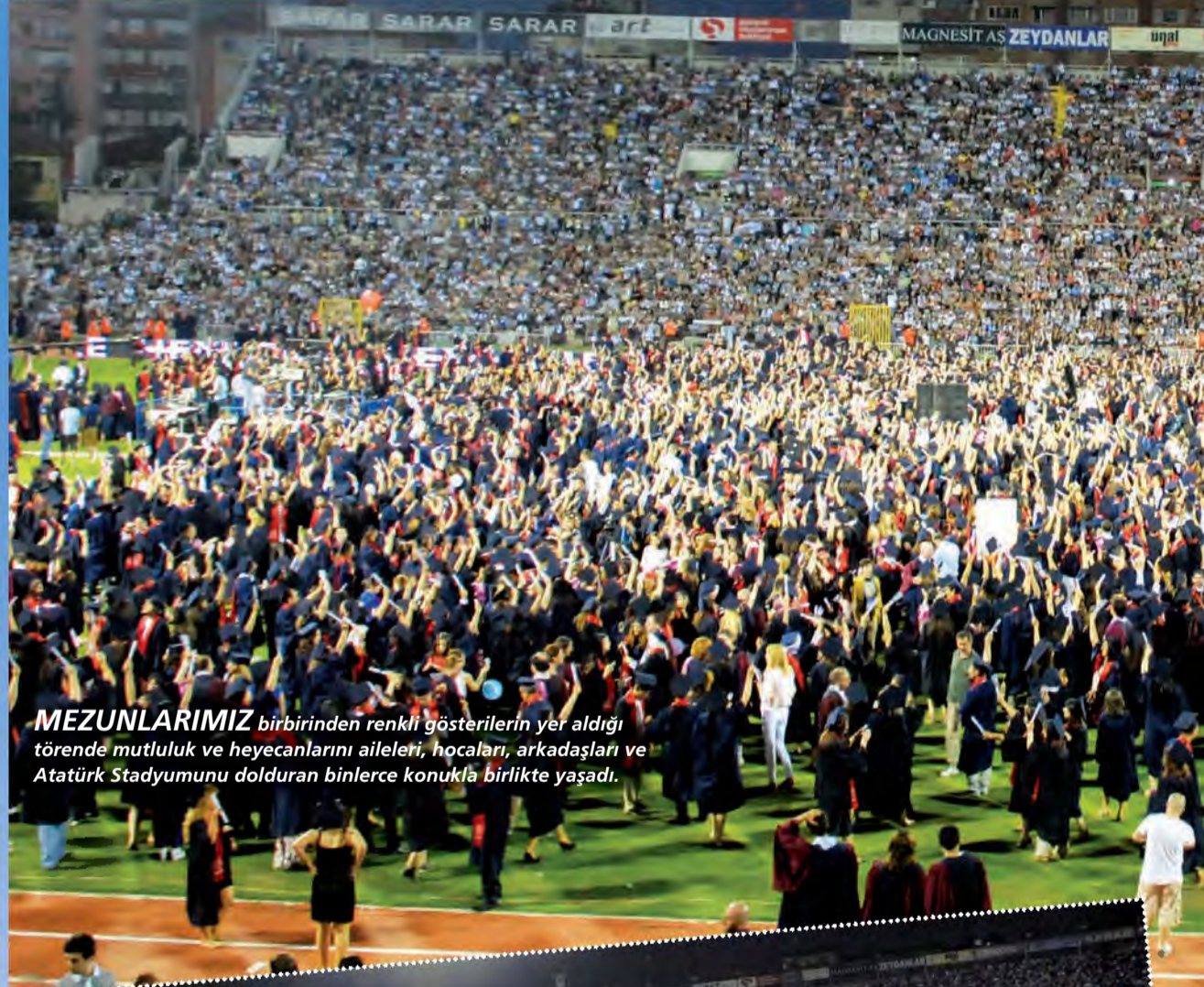
MEZUNLARIMIZ birbirinden renkli gösterilerin yer aldığı törende mutluluk ve heyecanlarını aileleri, hocaları, arkadaşları ve Atatürk Stadyumunu dolduran binlerce konukla birlikte yaşadı.