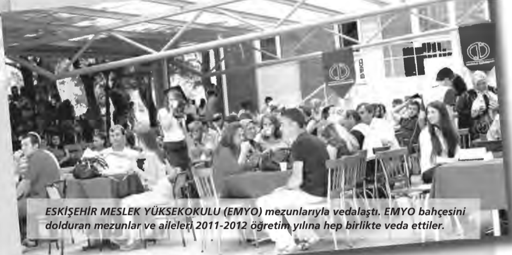
ESKİŞEHİR MESLEK YÜKSEKOKULU (EMYO) mezunlarıyla vedalaştı. EMYO bahçesini dolduran mezunlar ve aileleri 2011-2012 öğretim yılına hep birlikte veda ettiler.