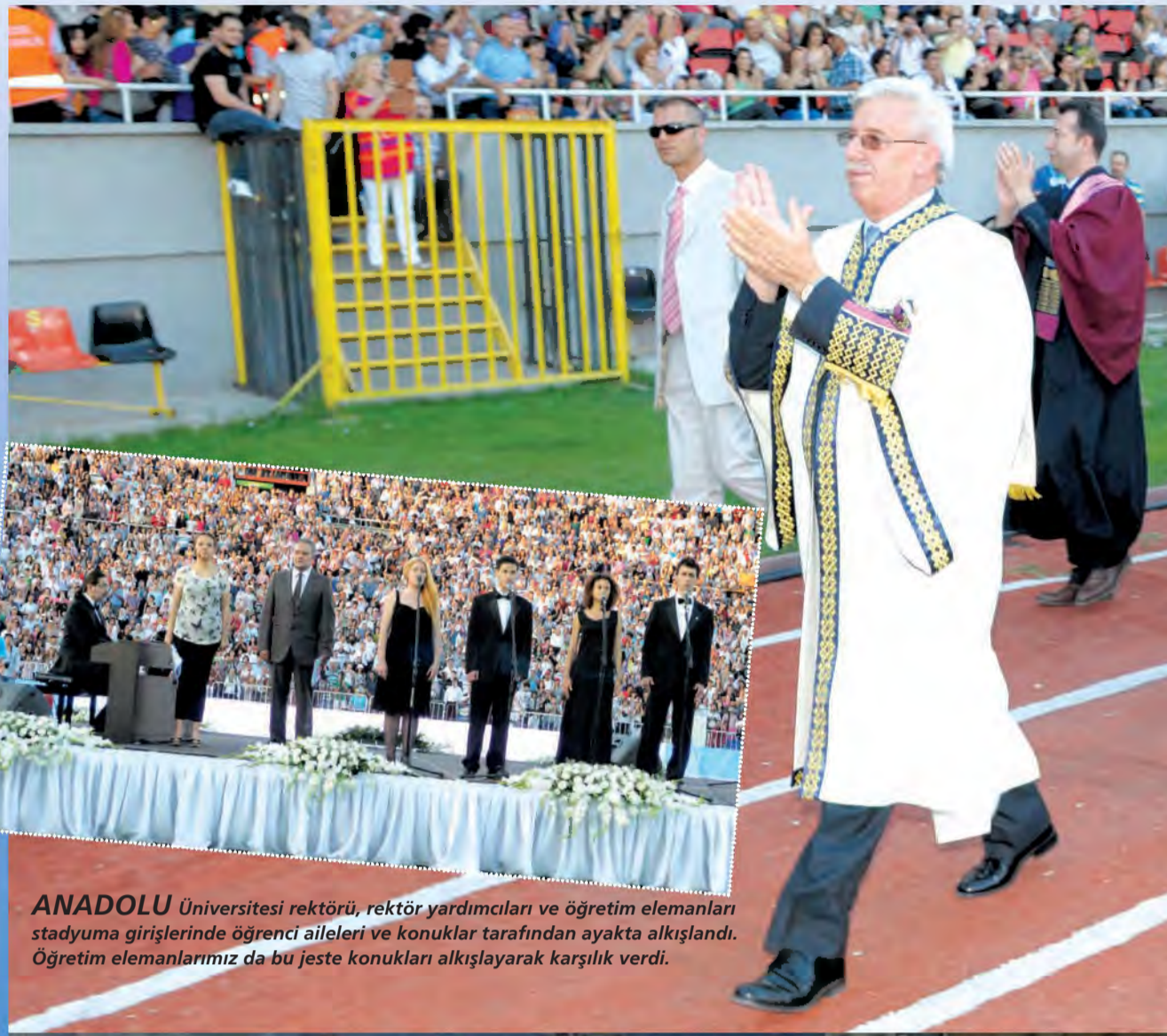
ANADOLU Üniversitesi rektörü, rektör yardımcıları ve öğretim elemanları stadyuma girişlerinde öğrenci aileleri ve konuklar tarafından ayakta alkışlandı. Öğretim elemanlarımız da bu jسته konukları alkışlayarak karşılık verdi.

tü. Başladığımız zaman bir sarı sandalye bir telefon vardı. Bugün Türkiye'nin hatta dünyanın sayılı üniversitelerinden biri hâline geldik. Bu hâle getirmek için, benimle beraber çalışan insanlar ve bugün çalışmakta olan bütün arkadaşları kutluyorum. Hepinize sevgiler ve saygılar sunuyorum. Genç arkadaşlarımıza ellerindeki hayat çalışmasında başarılar diliyorum, gözlerinizden öpüyorum. Öğrencileri, Anadolu Üniversitesini seçtikleri için kutluyorum ve teşekkür ediyorum, onlara saygılar sunuyorum. Anadolu Üniversitesinde gösterdiğiniz başarıyı yakın gelecekte hayatta da gösterecek ve memleketimizin kıvanç duyacağı insanlar olacaksınız."