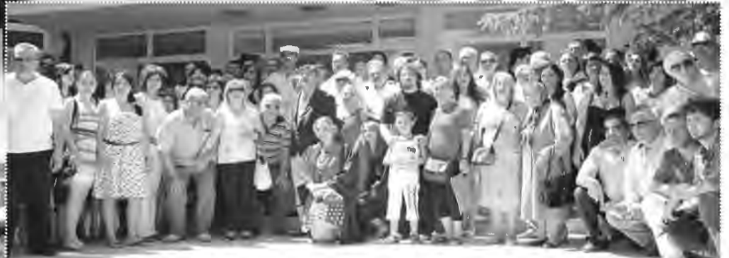
GÜZEL SANATLAR FAKÜLTESİ 2011-2012 öğretim yılını kapatırken, mezunlarını fakülte bahçesinde düzenlenen törenle uğurladı.