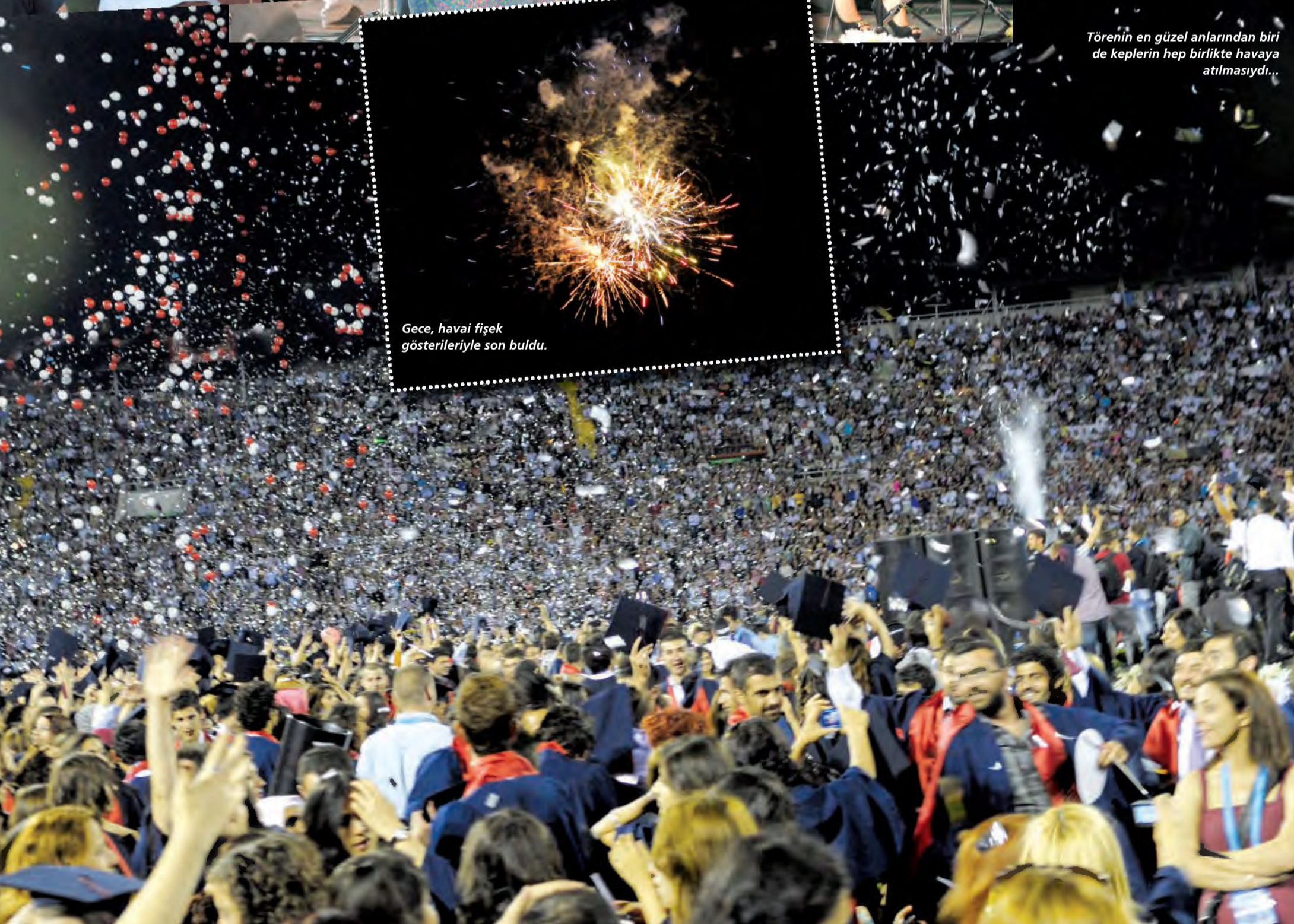
Gece, havai fişek gösterileriyle son buldu.