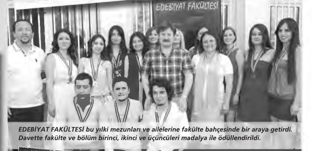
EDEBİYAT FAKÜLTESİ bu yılki mezunları ve ailelerine fakülte bahçesinde bir araya getirdi. Davette fakülte ve bölüm birinci, ikinci ve üçüncüleri madalya ile ödüllendirildi.