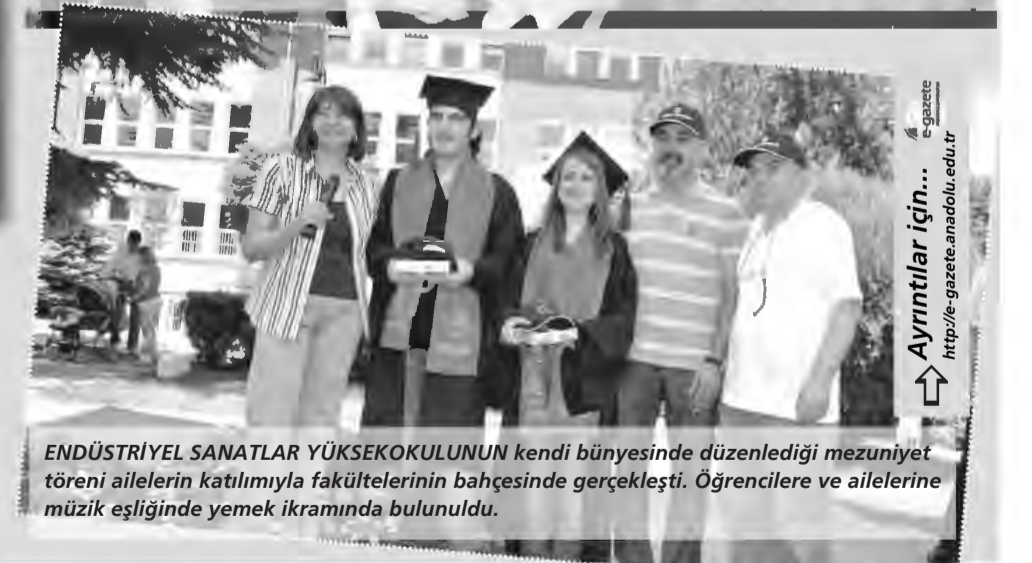
ENDÜSTRİYEL SANATLAR YÜKSEKOKULUNUN kendi bünyesinde düzenlediği mezuniyet töreni ailelerin katılımıyla fakültelerinin bahçesinde gerçekleşti. Öğrencilere ve ailelerine müzik eşliğinde yemek ikramında bulunuldu.