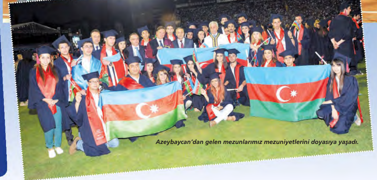
Azerbaijan'dan gelen mezunlarımız mezuniyetlerini doyasıya yaşadı.