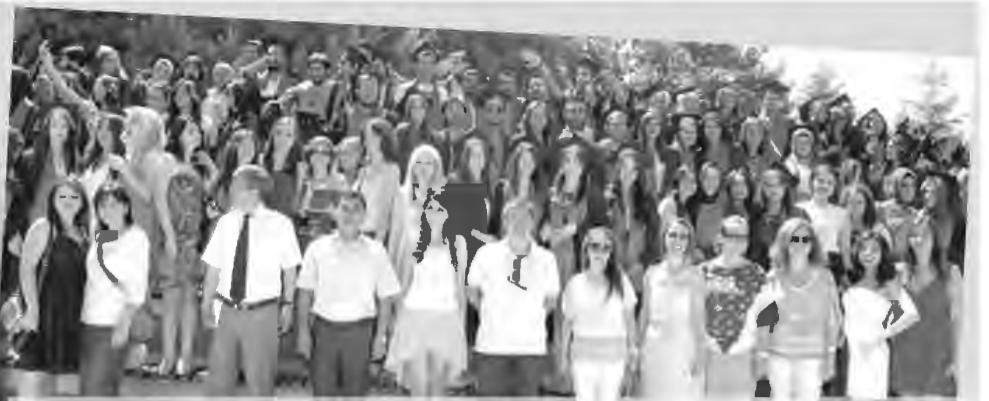
İKTİSADİ VE İDARİ BİLİMLER FAKÜLTESİ , 800'ün üzerinde mezunu ve aileler ile fakülte bahçesinde buluştu. Hayata yeni bir başlangıç yapacak yeni mezunlar hüznü ve mutluluğu bir arada yaşadı.