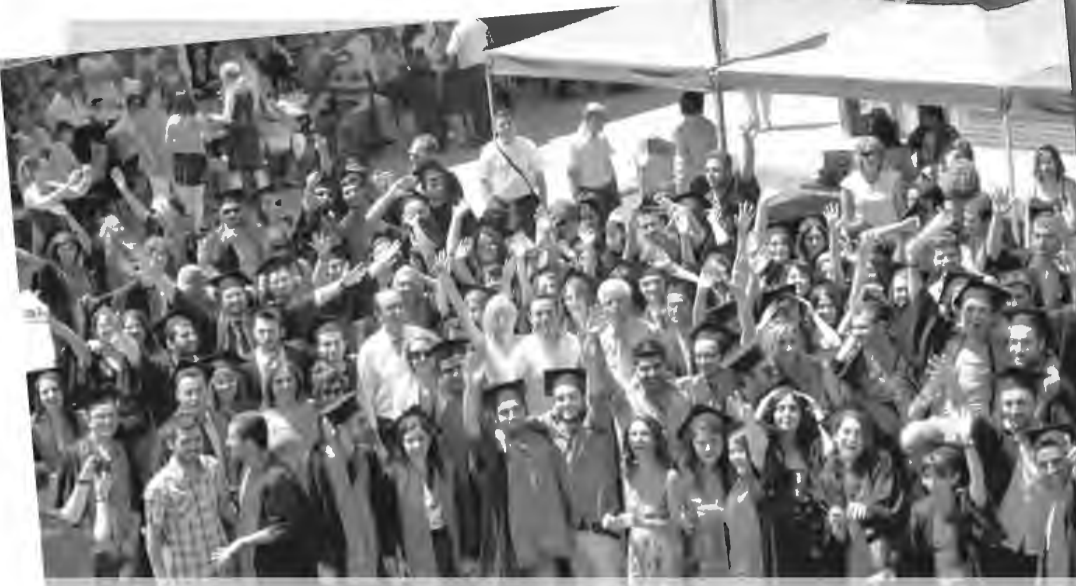
İLETİŞİM BİLİMLERİ FAKÜLTESİ fakülte bahçesinde düzenlenen etkinlikte mezun öğrencilerin ailelerini de ağırladı. Etkinlikte Basın ve Yayın Bölümünün bu sene ilkinin düzenlediği yarışmanın ödülleri sahiplerini buldu. Mezunlara ve ailelerine çiğ börek ikram edildi.