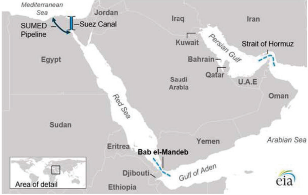
Harita 2: Geo-Stratejik Alanı ile Bab el-Mandab 10

Aden bölgesi bu güzergâh üzerinde gemilerin çeşitli ihtiyaçlarını karşılamak için durdukları liman şehirlerini barındırmaktadır. Genel olarak deniz taşımacılığı açısından eski Baharat Yolu’nun bir kolu olarak Aden Körfezi ve Bab el-Mandab Boğazı, günümüzde hala ticari geçişler açısından önem arz etmektedir. Kızıldeniz’e kıyısı olan tüm devletler için stratejik olan bu körfez Hint Okyanusuna kıyısı olan devletler için de önemlidir (Semin, 2015). Bu önem Harita 2 ile gösterildiği üzere Hürmüz Boğazı’ndan Arap Denizi’ne ve Hint Okyanusu’na ve oradan da Bab el-Mandab geçişi ile Doğu Akdeniz’e uzanan deniz iletişim hatları ve boğum noktalarını içinde barındıran alan ile kendini göstermektedir. Bu noktadan hareketle örneğin Çin’in ihracat gemileri bu güzergâh üzerinden Batı Avrupa’ya ulaşmaktadır. Yine Yemen’in hâkimiyetinde bulunan Socotra takım adaları da Hint Okyanusundaki deniz ticaretinin güvenliğinin ve kontrolün sağlanması anlamında üs kurulması açısından özellikle ABD ve Rusya’nın hedefinde olmuştur (Hoffman, 2022). Tabiatıyla Yemen’in belirtilen stratejik önemi sadece bir iç savaş iken başka devletlerin de aktörler olarak devreye girdiği bir savaş alanına dönüşmüştür.