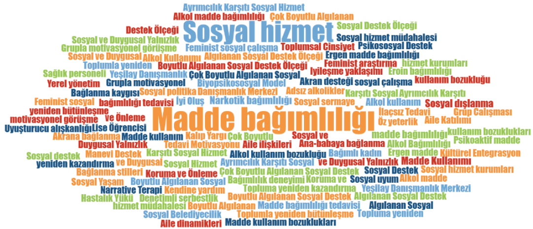
Şekil 1. Anahtar Kelimeler ve Kullanım Sıklıklarına İlişkin Etiket Bulutu