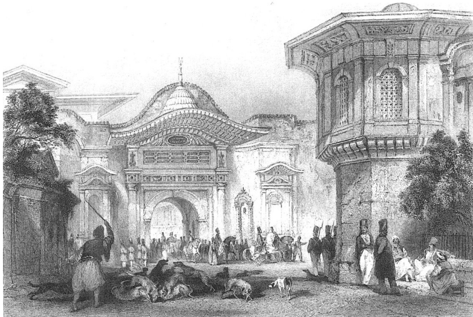
Resim 2: Bab-ı Ali ve Alay Köşkü (Kaynak: R. Walsh. ve T. Allom. (1839). Constantinople and the Scenery of the Seven Churches of Asia Minor . Londra: Fisher & Son Company, 2. Cilt, s. 66-67)