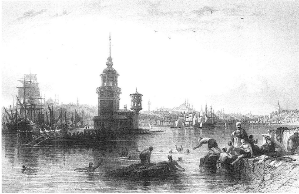
Resim 3: Kız Kulesi