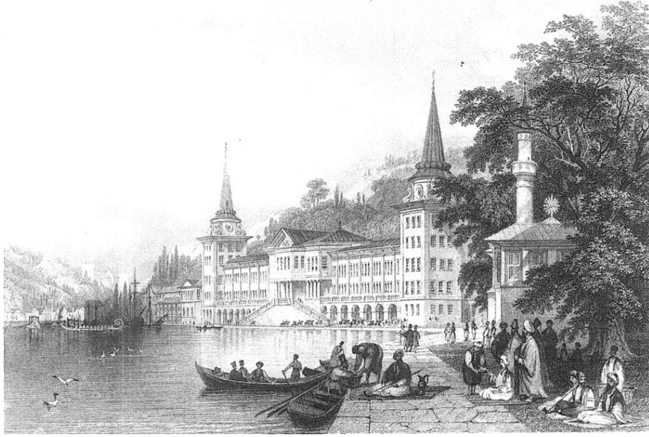
Resim 5: Çengelköy’de süvari Kışlası (Kaynak: R. Walsh. ve T. Allom. (1839). Constantinople and the Scenery of the Seven Churches of Asia Minor . Londra: Fisher & Son Company, 2. Cilt, s. 64-65)

Mimarlığı ve ressamlığı dışında, Allom’un yaptığı panorama sergileri 28 de oldukça önemli bir yere sahiptir. Temmuz 1850’de, Regent Street Polytechnic bitişiğindeki Exhibition Theatre’da Osmanlı topraklarında yaptığı çizimlerini kullandığı panorama sergisini -üçüncü kez- açmıştır. 29 Serginin tanıtımı için yazdığı Polyorama ’nın girişinde “hareketli panorama”larda bilgiyi eğlence yoluyla aktarma yönteminin, dönemin sanatının yararlarına dair en geçerli alanlardan biri olduğunu aktarmıştır. 30 Dönem İngilteresinin panoramik sergilere ve özellikle İstanbul konusuna ilgisi düşünüldüğünde bu serginin ne kadar rağbet gördüğünü tahmin etmek mümkündür. Öyle ki 1850’de üçüncü kez sergilendiğini bildiğimiz bu panorama 1854’te Egyptian Hall’da dördüncü kez sergilenmiştir. 31 Dört serginin tamamının nerede düzenlendiği bilinmese de Polyorama ’nın metninden anlaşıldığı üzere hareketli bir panorama olduğu; yine Polyorama broşürünün de hem şematik hem de retorik açıdan özenli, eserlerin sergilenme sırasına göre tanıtımlarını içeren metinlerinde de hitabetin güçlü olduğu söylenebilir. 32