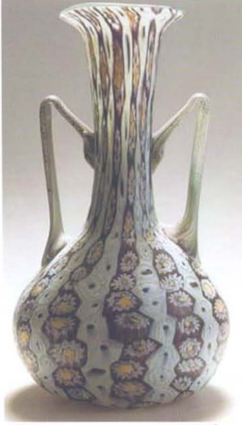
Resim 4. Murrine Vazo, Toso Kardeşler, 1910.