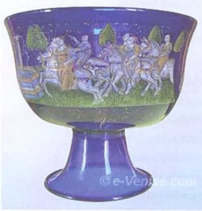
Resim 1. Coppa Barovier, Angelo Barovier, 15.yy. www.e-venise.com&nbsp;nbsp; www.vam.ac.uk.

Venedik, camcılıkta zamanla ulaşılan teknolojiyi ve sanatsal düzeyi korumak için bazı tedbirlere başvurmak zorunda kalmıştır. Çünkü Venedik için camcılık büyük bir ticari getirisi de olan ayrıcalıklı bir endüstri, bir know-how'dur ve bunu da kimseyle paylaşmak istememektedir. Bu sebeple 13. yüzyılın sonlarından itibaren cam atölyelerinin büyük ölçüde Murano adasında toplandıkları görülmektedir. Cam ustalarının Venedik dışına bilgi çikarmaları kesinlikle istenmemekte ve yasaklanmaktadır. Bu ustaların bir başka yere göç etmeleri, yerleşmeleri de yasaktır. 1600'lerde ise Muranolu ustalar topluluğundan kişilerin dahil olduğu Altın Kitap'ta (Libro d'oro) isim yazılı olan cam ustalarının ve onların yakın akrabalarının, sadece, cam atölyesi açmak ve camcılıkla uğraşmak hakkı olacaktır.