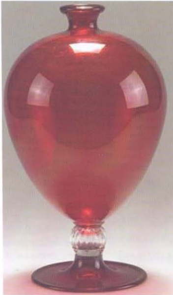
Resim 5. Veronese vazo, Vittorio Zecchin, 1921. www.e-venise.com&nbsp;nbsp;nbsp; www.vam.ac.uk.

Bununla beraber altmış yıl kadar süren bu süre zarfında, unutulmuş olan geleneksel tekniklerin, Pietro Bigaglia gibi cam ustaları tarafından araştırılıp canlandırılmaya başlandığı görülmür. Fakat esas canlanma 19. yüzyılın ikinci yarısında başlayacaktır. 1854 yılında Murano'lu Toso kardeşler cam atölyelerini açarlar. İlk birkaç sene sıradan cam eşyalar ürettikten sonra sanat camı üzerinde çalışmaya başlarlar. Öte yandan bu tarihlerde eski Murano camı koleksiyoncuları da Venedik camının canlanmasına katkı sağlayacaklardır. Milanlı girişimci bir avukat olan Antonio Salviati de Venedik'teki özellikle de St. Mark Bazilikasındaki antik mozaik süslemelerinin ihmalle geleneğinden duyduğu üzüntü ile öncelikle cam mozaik üzerinde çalışmak için fakat daha sonra üretimini diğer alanlara da genişletmek üzere 1859 tarihinde bir cam fabrikası kurar. Bu konularda kendisini destekleyen Murano belediye başkanı Antonio Colleoni, cam tarihiyle ilgilenen rahip Vincenzo Zanetti ve Salviati geleneksel tekniklere dayanan camcılığın yeniden ya-