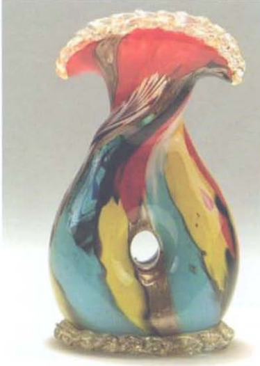
Resim 8. Oriente Vazo, Dino Martens, 1952.