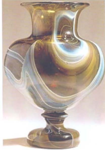
Resim 2. Chalcedonio Vazo, Lorenzo Radi, 1859 www.e-venise.com&nbsp;www.vam.ac.uk

18. yüzyıl Venedik üstünlüğünün sona ermeye başladığı çağdır. Bu çağda sanayi devrimi ve Bohemya, İngiltere, Fransa, İspanya gibi rakip camcılık merkezlerinin oluşması nedeniyle Venedik camcılığının bir krize girdiği görülmektedir. İngiliz ve Bohemya kurşun camı zamanın moda üsluplarına ve zevkine daha uygundur. Yüzyıl sonunda Venedik camcılıktaki pazar kaybının yanı sıra ekonomik ve politik krize de girecektir. 1797'den sonra Fransızların eline geçmiştir. 1814'de ise Avusturya-Macaristan imparatorluğunun eline geçer. Bu gelişmeler Venedik camcılığını derinden etkiler. Avusturya-Macaristan imparatorluğunun gelecekte kendine bağlı gördüğü Bohemya camcılığı lehine Venedik camcılığı üzerinde kısıtlamalara gider. Bu sebeple hammadde alımına sınırlamalar getirir ve ağır vergiler uygular. Bu durum Venedik'te cam ticaretini ciddi biçimde durgunlaştırır. Venedik camcılığı artık sadece yeni egemen için boncuk türünde cam üretimi yapan sığ bir endüstri konumuna düşmüştür.