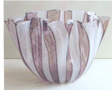
Resim 7. Fazzoletto vazo, Fulvio Bianconi, 1955 www.e-venise.com&nbsp; www.vam.ac.uk.