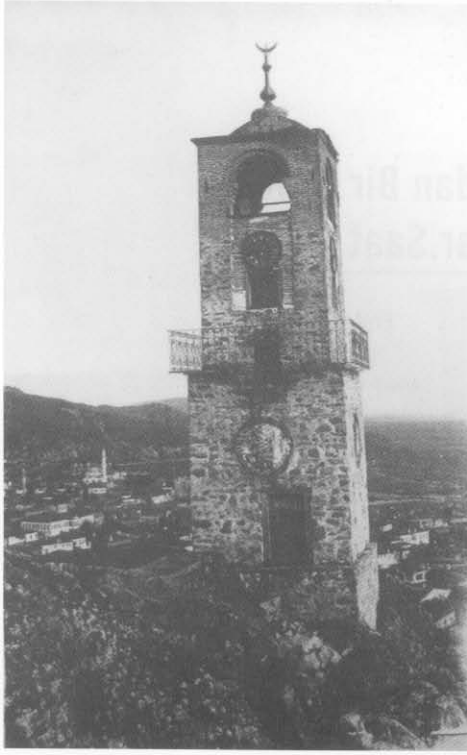
Sivrihisar Saat Kulesi

kentlerinde ortaya çıkmaya başladığı görülen saat kuleleri özellikle başkent İstanbul'da dönemin mimari anlayışına uygun olarak yapıldıkları bilinmektedir. Sultan II. Mahmut Dönemi'nde (1808-1839) Nusretiye Camii çevresinde topçu teşkilatıyla ilgili olarak yapılan bazı yapılarla birlikte bir saat kulesi inşa edilmiştir. Ayrıca, Dolmabahçe Sarayı ve camii arasında bulunan meydana da bu iki yapının mimari tarzlarına uygun olarak bir saat kulesi yerleştirilmiştir. 5