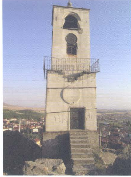
Soldaki Resim, Saat Çanının Bulunduğu Üst Kule