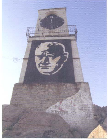
Güneyden Genel Görünüm

Bugün sıva kaplı olan duvarlar beyaz sıva ile badanalanmıştır. Eski fotoğraflardan altta bulunan kulenin cephelerinde yuvarlak pencerelerin olduğu görülmektedir. Ancak günümüzde izleri görülen bu pencereler sonradan kapatılmıştır. Kulede bulunan saatlerden yalnızca güneyde bulunan çalışır durumdadır.