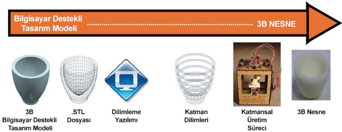
Şekil 2. Katmansal Üretim Süreci (Campbell, Williams, Ivanova, ve Garrett, 2011, s.3)

3B yazdırma teknolojileri kavramı altında 3B yazıcılar, 3B modelleme yazılımları, 3B tarayıcılar ve 3B mürekkep (filament) bulunmaktadır. 3B yazıcılar modellerden fiziksel nesnelere üretebilmek için 3B modelleme yazılımlarına ihtiyaç duymaktadır. Bu yazılım çeşitleri arasında bilgisayar destekli profesyonel 3B tasarım yazılımlarından (AutoCAD, 3DS MAX), amatör tasarımcılar tarafından tercih edilen ve kolaylıkla kullanılabilen web tabanlı yazılımlara (SketchUp, Tinkercad, Autodesk123D) kadar geniş bir alternatif bulunmaktadır. Bu yazılımlarda üretilen dijital 3B modeller, ince katmanlar halinde dilimlendirilerek 3B yazıcılar aracılığıyla somut fiziksel nesnelere üretilmektedir. 3B tarama, fiziksel nesnelere 3B modellerini oluşturmak amacıyla taraması ve dijitalleştirilmesidir. 3B tarayıcılar kullanılarak var olan nesnelere ait dijital 3B modeller oluşturulabilmektedir. 3B mürekkep olarak adlandırılan ince tel (filament) hammaddeyi kullanarak dijital modeller fiziksel nesnelere dönüşebilmektedir. 3B yazıcılarda hammadde olarak plastik, toz, reçine, oyun hamuru, seramik, metal, yiyecek hammaddeleri, biyomateryal malzemeler, çimento, cam, çeşitli metaller, metal alaşımları ve bileşik malzemeler kullanılabilir (D'aveni, 2015; Olla, 2015). Bununla birlikte en çok tercih edilen yazdırma materyali olarak dayanıklılığı ve sertliği ile bilinen plastik kullanılmaktadır.