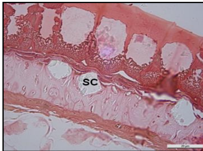
Şekil 3. Marrubium globosum Montbret & Aucher ex Benth.'de testanın yapısı. Bar = 20 \mu m. SC. Salgı cepleri