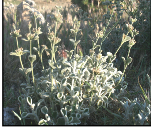
Şekil 1. Marrubium globosum 'un genel görünüşü.

toluidin mavisi ile boyandıktan sonra ışık mikroskopunda incelenerek fotoğrafları çekilmiştir.